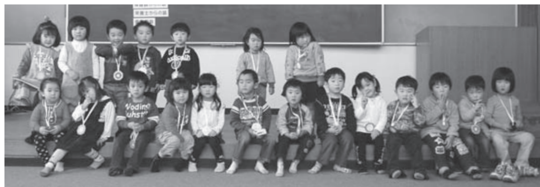
▲12月16日の3歳6カ月児健診を受診した子どもたち