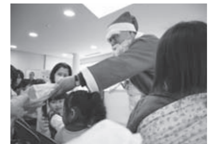
▲サンタさんの登場に沸き立つ会場内

昨年12月19日、ふれあいプラザでファミサポ・子育て支援センター共催のクリスマス交流会を開催しました。当日は、51組110名の親子と、お手伝いの提供会員さんが参加。マジックショーや歌、踊り、絵本の読み聞かせなど、盛りだくさんの内容でクリスマス気分を満喫しました。