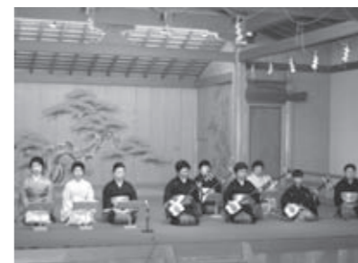
▲弥登孝会の皆さんによる長唄の様子

始めに関係者が能舞台上がり、古典芸能の隆盛を願う「舞台清め式」が行われました。その後、「高砂を謡う会」の皆さんの発表をはじめ、伝統芸能振興会9団体の皆さんが、神楽や謡曲、日本舞踊や箏曲、長唄や詩吟などを次々と披露。昨年の10月から実施している「子ども能楽教室」に参加している子どもたちも、練習の成果を披露しました。