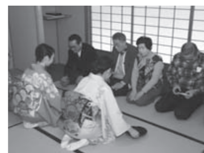
▲万物の芽吹きを感じながら一服

また、1月18日には新春茶会が行われ、一般参加者80名ほどが参加しました。参加した皆さんは、訪れる春の息吹を感じながら、茶の湯を満喫していました。