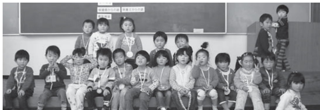
▲11月25日の3歳6カ月児健診を受診した子どもたち