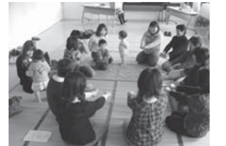
▲交流を深める参加者の皆さん