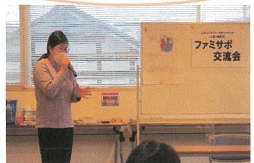
会員の発表の様子