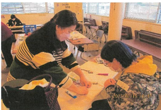
レザーのバックチャーム製作の様子