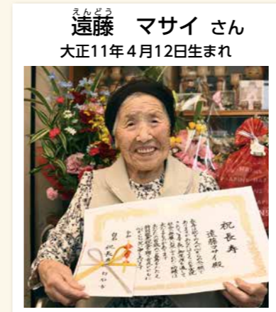
▲いつも笑顔で周りを楽しませてくれるというマサイさん。趣味は編み物とのこと