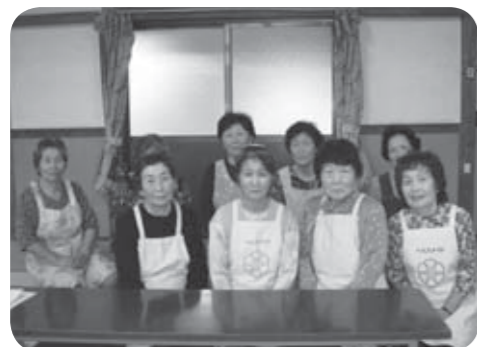
ヘルスメイト白石 白川地区の皆さん