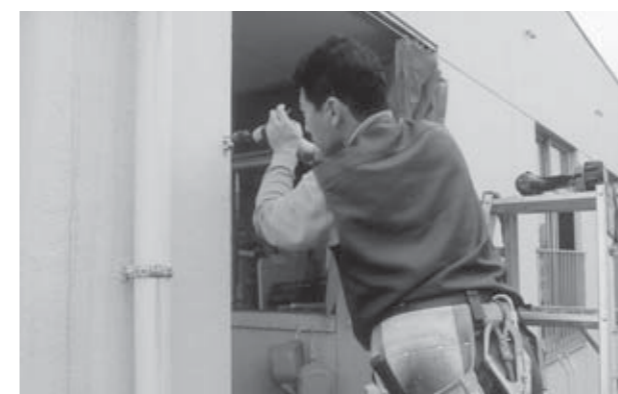
▲正確かつ機敏に作業を行う大工さん(深谷保育園)

10月26日、白石市建設職組合青年部の皆さんが、市内8保育園で棚の設置などの奉仕作業を行いました。同組合青年部では、20年ほど前から子どもたちの保育園生活に少しでも寄与したいと、年に一度奉仕作業を行っています。この日も市内の建設会社などで働く大工さん21名が、それぞれ担当する保育園に分かれて作業を実施。ホール・事務所での棚の設置や網戸の取り換え、雨よけシート用レールの取り付けなどを行いました。2時間ほどで作業は終了。一仕事を終えた大工さんに、各園の担当者から感謝とねぎらいの言葉が送られました。