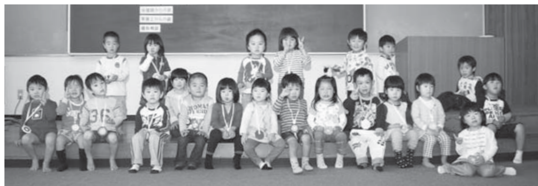
▲10月21日の3歳6カ月児健診を受診した子どもたち