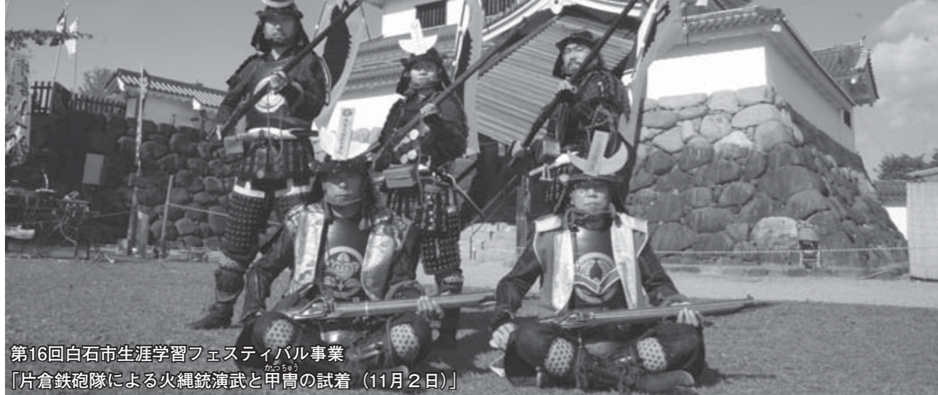
第16回白石市生涯学習フェスティバル事業 「片倉鉄砲隊による火縄銃演武と甲冑の試着（11月2日）」