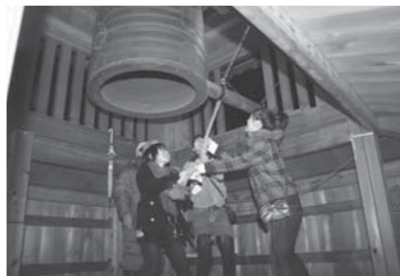
▲昨年の大みそかの「除夜の鐘を鳴らす会」の様子。

今、女性の間で人気の生の花を特殊な保存液につけ、自分の好きな色に染め乾燥させた花。だから本物の生の花と同じ風合いで、水なしで何年も咲き続ける夢のような花なのです。現在、私たちのサークルは、お花好きの仲間5名で毎月いろいろな手作りアレンジを楽しんでいます。興味がある方は、私たちと一