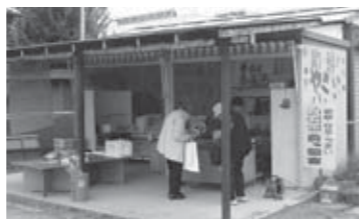
▲本郷店(旧国道113号角田街道踏切そば)