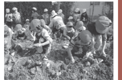
▲「大きい見付けたよ!」と、手を泥んこにしながらかみで土を掘る子どもたち