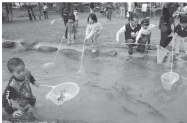
▲今年から始まったニジマスすくいのコーナーは大人気

恒例となったこのイベントには、市内をはじめ福島県や仙台市などから約1,300人の皆さんが訪れました。本年からは休校になった分校と、放牧地に釣り堀などを整備した、地域内の公園の2カ所を会場として、子牛とのふれあい体験やバター作り、ニジマスすくいや干し草ボールでの宝探しなど、大人も子どもも大はしゃぎで、不忘の大自然を満喫していました。