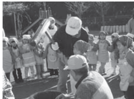
▲「おいしいおもちになあれ」と、もちつきに挑戦!