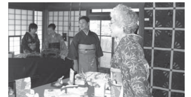
▲「白石城下きものまつり」で大活躍!

す。日本の伝統文化である着物の楽しみを若い方々へ伝えたい、着物(和装)に関する知識を深めたい、また、地域の活性化にぎわいづくりに貢献していきたいと意欲的に活動しています。