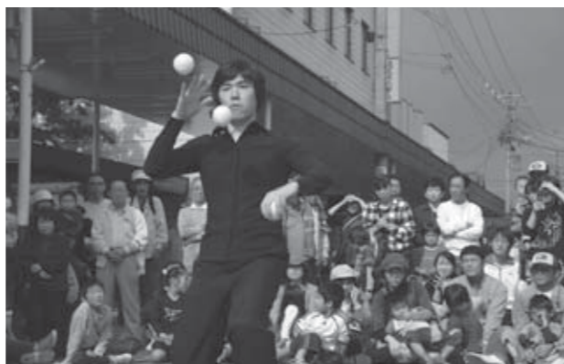
▲歓声と拍手が次々とわき起こったジャグリング

10月19日、市内中心部で白石商工会議所が主催する「大道芸&鍋食べまくり」が開催されました。さわやかな秋晴れに恵まれたこの日は、開始時刻の10時からたくさんの市民が中町に設けられた歩行者天国に詰め掛け、披露された世界トップクラスの大道芸やよさこい踊り、フラダンス、沖縄の創作舞踊「エイサー」、ギター演奏などを堪能。正午前には気仙沼・仙台・白石の各商工会議所青年部の皆さんによる自慢の地元鍋と、(株)カキヤさんの創立35周年鍋を一口味わおうと長い行列が出来上がり、目と口で穏やかな休日を楽しんでいました。