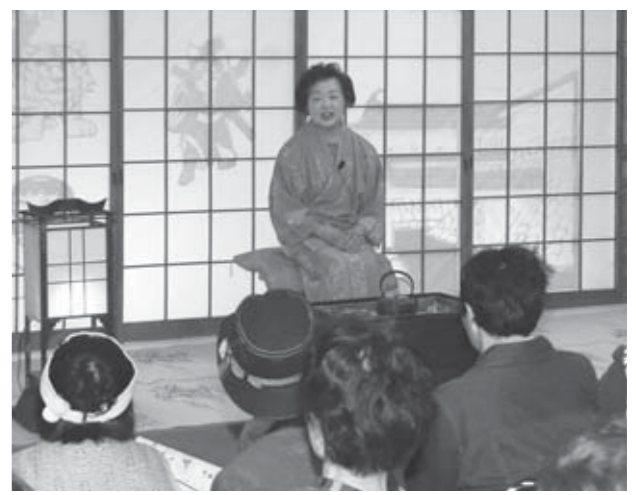
▲舞台も昔話を演出

皆さんそれぞれの地域の方言による昔話に、大人も子どもも真剣に聞き入っていました。