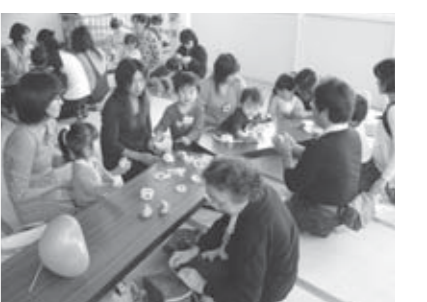
▲たくさんの人でにぎわうファミサポ

ファミサポでは、今後も親子が楽しめる催しを企画していきますので、お友達とお誘い合わせの上、ぜひお越しください。