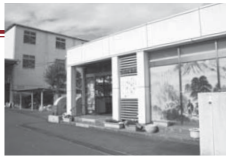
◀手延べの麺は1日3千食、機械生産の麺は1日5万食の生産能力を誇る同社工場

ありがとうございます。製薬会社の仲間から「体に良い物を作れよ」と言われたのがきっかけで、企業理念に「健康」を加えました。海藻のアカモクには、ネバネバに体にとっても良い成分が含まれています。においなどの課題がありましたが、無事に商品化することができました。アカモクは松島などで取れた物を使用しており、