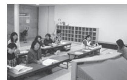
▲意見交換も行われた勉強会

10月23日に、第3回勉強会を開催しました。子どもの発達や事故防止について学習した後、子どもと大人の人間関係や、大人同士の人間関係について学びました。特に、子ども預かる上での接し方など、実践的な点について経験を交えた意見交換なども行いながら理解を深めました。