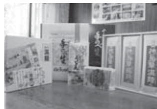
▲定評の高い商品の数々

和紙やうーめんなど、白石は文化の宝庫だと思います。今後もおいしさはもちろん、体に良い商品を皆さまに提供するとともに、「食」の面で市の観光を支えていければと思います。また、薬師の湯では私たちのうーめんが食べられますので、ぜひご利用いただきたいと思っています。