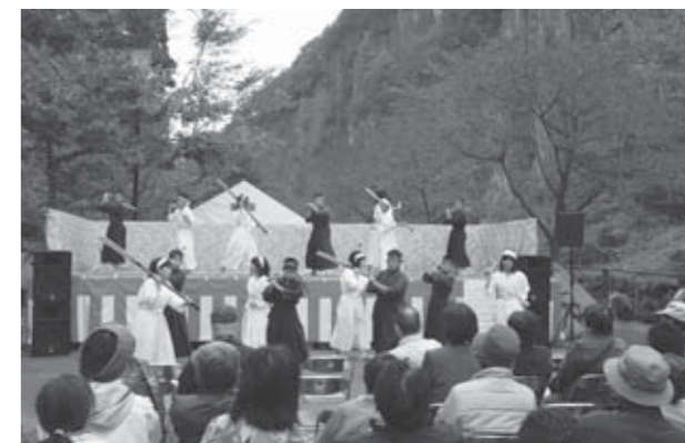
▲大鷹沢小学校の皆さんによる団七踊り披露

11月3日、材木岩公園内で秋の検断屋敷まつりが行われました。恒例となった小原地区の皆さんによる南中ソーラン踊りや、大鷹沢小学校の皆さんによる団七踊り、地元の皆さんによるカラオケなどのステージ発表が披露され、来場者から大きな拍手が送られたほか、同日にいきいきプラザで行われた「みちのくおとぎ民話フェスタ」の第2会場として、検断屋敷内では民話の語りや腹話術、紙芝居なども実施。毎年恒例のりんごの皮むき大会やだるま落とし大会なども行われ、会場は一日中、たくさんの人でにぎわいました。