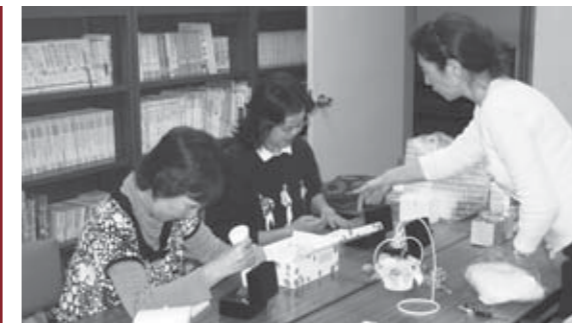
▲月1回の活動はとても楽しみです

緒に優しい花に癒やされて、お部屋も心も満たされてみませんか。入会ご希望の方は、ぜひ見学においでください。お待ちしております。