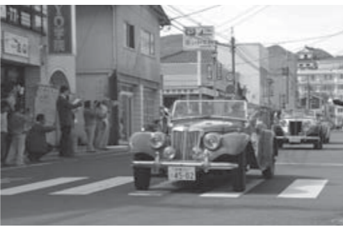
▲市内商店街を走るクラシックカー

● 問い合わせ 商工観光課 ☎22-1321 ■ラ・フェスタ ミレミア運営事務局オフィシャルホームページ http://www.lafestamm.com ■白石市ホームページ http://www.city.shiraiwa.miyagi.jp ■白石市観光協会ホームページ http://www.shiraiwa.ne.jp