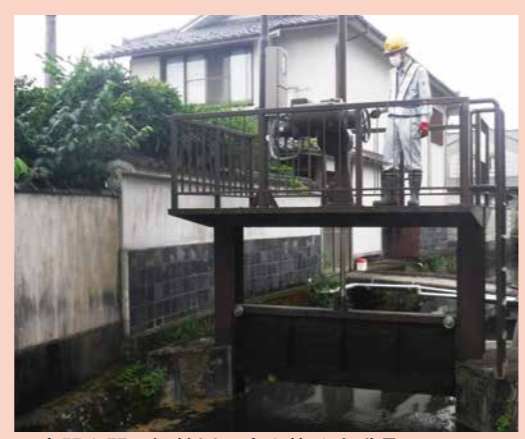
▲水門を開け沢端川の水を抜く市職員

春季川干し 用水路の維持管理のため、川干しを行います。火の元には十分ご注意ください。また、各ご家庭の周囲の側溝や占用箇所の土砂上げなどへのご協力をお願いします。 ●実施区域 樋ノ口用水路・館堀用水路・沢端川ほか ●実施期間 3月25日(金)17:00～29日(火)9:00 (5日間。夜間を含む) ☎建設課 ☎22-1326 白石市土地改良区 ☎25-9717