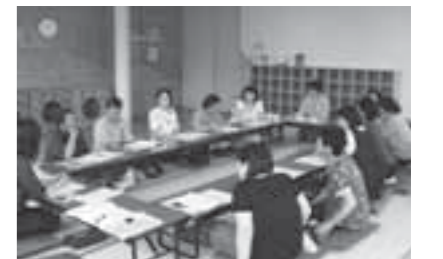
▲第1回勉強会の様子

よりよく子どもさんを預かり、ご家族をサポートするために、ファミサポでは年4回勉強会を開いています。1回目の勉強会を6月19日に開催し、子どもさんを預かるときの注意点や、親御さんとのかわり方などについて学びました。次回は9月を予定しています。