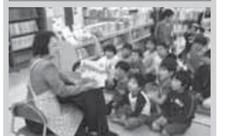
▲おはなしひろばの様子