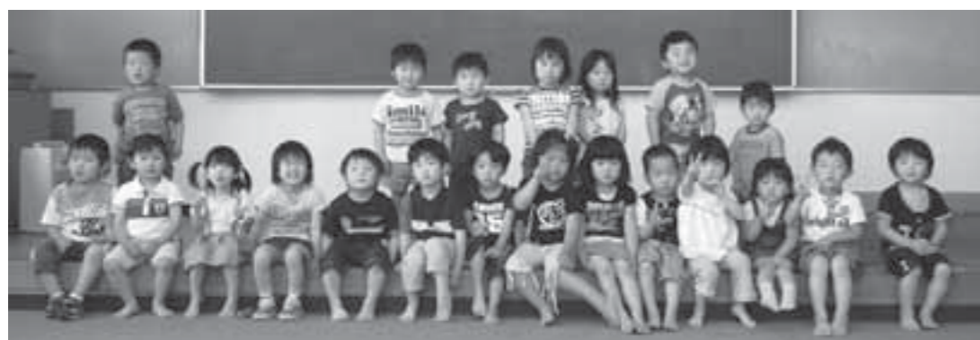
▲6月17日の3歳6カ月児健診を受診した子どもたち