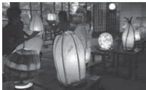
▲昨年の展示会の様子

華道小原流は、毎週金曜日の19時から21時までアルタ白石で活動しています。 小原流とは、古風なお花から今の暮らしにも似合うお花まで、いろいろなお花を生けることができる流派です。難しいことを学ぶよりも、まずはお花に聞いてみる、そんな先生の優しいご指導があり、お花も私たちが楽しい語らいのひとつを過ご