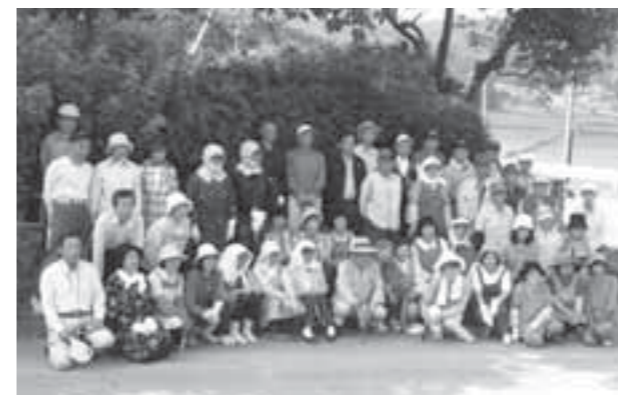
▲活動前に参加した会員全員での撮影

マリーゴールドの見ごろは8月から10月で、これからも、草取りや水やりなど手入れが必要です。地域の皆さんの連帯感が、越河平フラワー会の活動を支援していました。