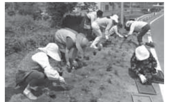
▲やる気応援事業補助金で種を購入し、苗を育てての植栽活動