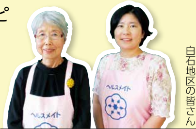
白石地区の皆さん