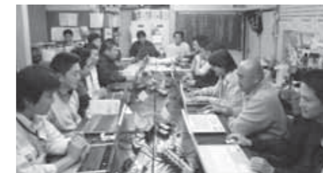
▲医療マップ作成実行委員会の様子

らおうと、それぞれのまちに寄贈される予定です。当院では、寄贈していただいたパンフレットなどを、今後の地域連携を図るための活動に活用していきたいと考えています。