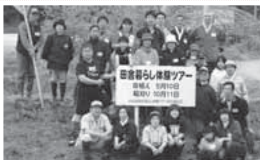
▲田植え体験を終えた参加者の皆さん。少々お疲れのご様子

交付金は集落協定に基づき総額の約2分の1以上を水路・農道などの維持管理、農地・農村の有する多面的機能を増進する活動や集落の活性化に要する費用に使用され、残りの交付金は、現に農地を維持管理することとなる農地の耕作者に面積に応じて支払われています。 詳しくは、農林課までお問い合わせください。