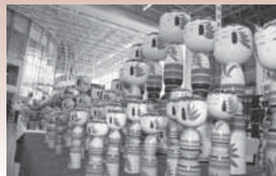
▲こけしが放つ木のぬもりを、次の世代に伝えていきましょう。