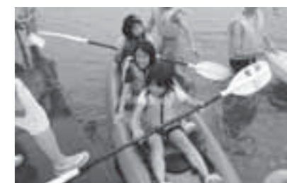
▲キャンプでのカヌー体験の様子

ジュニアリーダーたちと一緒に、夏のキャンプを体験しませんか? 他校の児童と交流が図れる、良い機会です。詳しい開催要項は各小学校を通してお届けしますので、皆さん、ぜひお申し込みください。