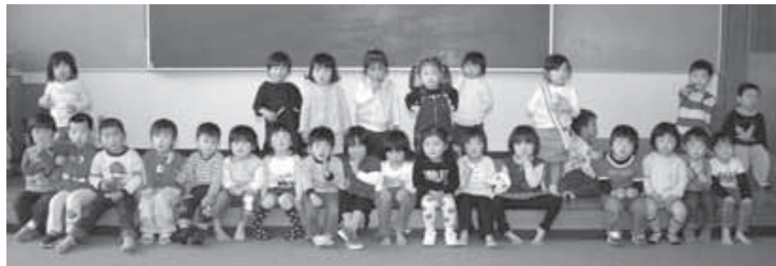
▲4月22日の3歳6カ月児健診を受診した子どもたち