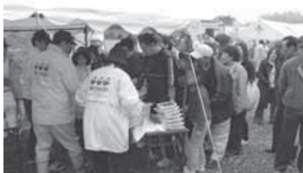
▲ヘルシービーフを買い求める人たちがいっぱい

この日は、約240kgの黒毛和種の牛肉が用意され格安で販売されたほか、地元農家の皆さんの新鮮で安全な農作物なども同時に販売され、多くの市民が開始前から会場に詰め掛けていました。