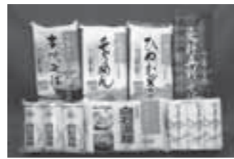
▲うーめんを核とした多彩な商品群

私たちはこれまで、蔵王山ろくろの美しい自然環境の下、安全でおいしい製品を作り続けてきました。常に地域に密着した企業であることを心掛けてきましたし、これからのその思いは変わりません。当社の製品の核は、やはり「うーめん」です。これからも市民の皆さんと共に歩んでいきたいと思ひますので、どうぞよろしくお願ひします。