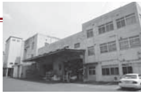
市内中心部にある白石興産(株)

やはり人間の口に入るものを作っていますので、その品質管理には最も注意を払っています。高品質でおいしい製品を消費者に提供したい。これは食品製造業者であれば、誰もが思うことです。私たちは創業以来、地元の企業として、地域産業の要であるうーめん、そしてまち全体が輝くようにと頑張ってきました。最近では、国内