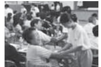
▲地域のお年寄りとの交流