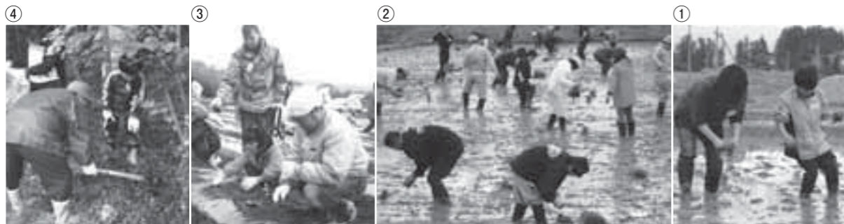
▲写真①/真剣な表情で苗を植える参加者の親子 写真②/田植え体験の全景 写真③/里芋の植え付けを行う家族(小下倉地区) 写真④/大鷹沢地区で行われたタケノコ掘り体験