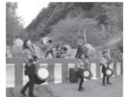
▲美しい大自然と景綱会の迫力ある演奏

※「小原いきいき直売所」については、19ページの「しろいし・フレッシュマーケットだより」に掲載しています。