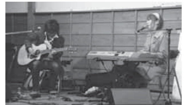
▲毎月第2土曜日、まちに心地よいメロディーが流れます。

S.A.P ホームページ http://sap.sokowonantoka.com/