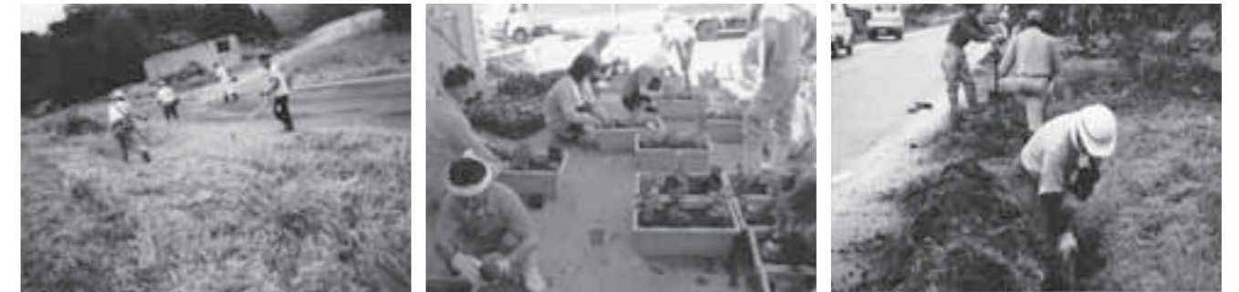
▲草刈りの共同作業(小原・大熊地区) ▲景観作物の共同作付け(福岡・上原地区) ▲水路の清掃も共同で(白川・犬卒都婆地区)

中山間地域等直接支払制度は、健全な農業・農村を維持・継続していくために、高齢化進行地域や農地が急傾斜地であったり、地形的条件により小区画・不整形であったりするなど、農業生産条件が不利な地域において一定の条件を満たした農地を有する集落が集落協定を締結し、農業生産活動や保全活動を行う場合に、5年間にわたって交付金をその集落に交付する制度です。 本市では8地区がこの制度を活用し、協定参加者の創意工夫により地域の活性化と、農村環境や景観の向上などに努めています。 また、集落を基礎とした営農組織の育成を行い、自律的かつ継続的な農業生産活動などの体制整備に向けた取り組みを行っています。 ■本市における該当地域 ●通常地域 (地域振興立法の指定地域) 小原地区 ※「特定農山村地域における農林業などの活性化のための基盤整備の促進に関する法律」第2条第4項の規定に基づき指定 ●特認地域 (宮城県知事が自然的・経済的・社会的条件が不利な地域として指定) 越河地区、齋川地区、大鷹沢地区、白川地区、福岡地区