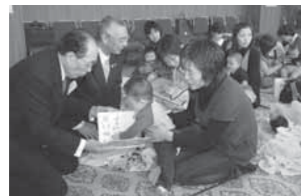
▲たくさん絵本を読んでもらってね!

赤ちゃんとその保護者の方に絵本(ブック)を贈り、その読み聞かせを通して、親子間のふれあいを深めてもらいたい。市社会福祉協議会では市と連携し、この「ブックスタート」の推進を図る取り組みを始めました。