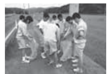
▲地域内の清掃活動を行う生徒たち