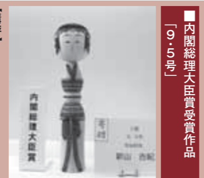
■内閣総理大臣賞受賞作品 「9.5号」

【講評】 弥治郎系伝統こけしの様式を、形態と描彩の両面から忠実に受け継ぎ、長年の研さんを積んで培った技術により、個性を加味して完成させることに成功した作品です。温和で可れんな表情と白い木肌は、鑑賞する人に和らぎを感じさせます。赤を基調にした色づかいが見事で、伝統こけしでありながら新鮮な雰囲気を感じさせる、優れた作品です。