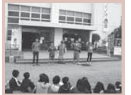
▲開会式でのジュニアリーダーのミニ演劇

今年のおまつりには、約500人の子どもとお父さん、お母さんたちが会場を訪れ、ペットボトルボウリングやおし花しおり作り、ECOブーメラン作りなど、たくさんの遊びや手作りのコーナーを親子一緒になって楽しんでいました。