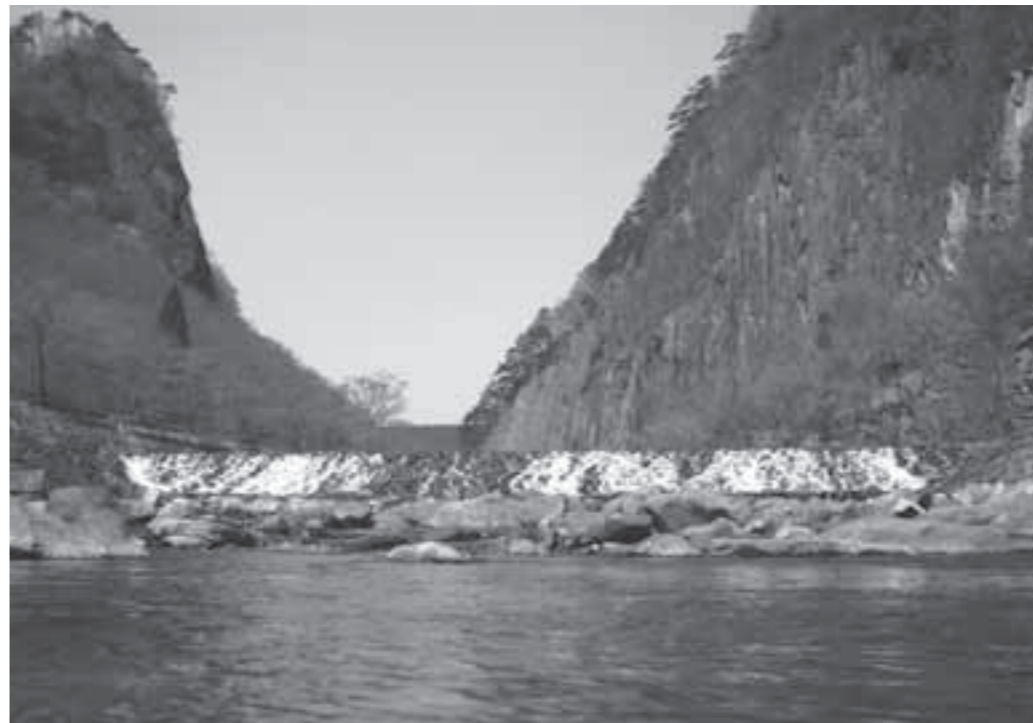
▲美しい水を利用した材木岩公園は、市民の憩いの場となっています。

■平成19年度の検査結果は水道法の水質基準にすべて適合 水道の水質検査の結果と水質検査計画は、厚生労働省の水質基準に関する省令の定めにより公表することになっています。そこで、本市の平成19年度の水質検査結果と、平成20年度