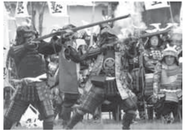
▲毎年、たくさんの観客が詰め掛ける火縄銃演武

た。8人の鉄砲隊の火縄銃から放たれる「ズドン」という大きな音に、詰め掛けた多くの観客からは大きな歓声が上がっていました。