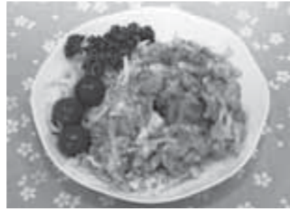
エネルギー212kcal/たんぱく質11.2g/塩分1.3g