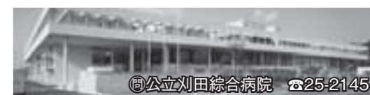
宮城県刈田総合病院 ☎25-2145