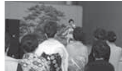
●写真上段/受賞作品に見入る来場者 ●写真中段/応援に駆け付けた宮城県のDCキャラクター「むすび丸」 ●写真下段/会場内で行われた「城の会」