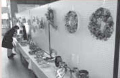
▲本年2月に行われたリサイクル作品展

今月号では、しろいしエコプロジェクト(愛称…もったいない運動)の拠点の一つでもある「白石市いきいきプラザ」をご紹介します。 「白石市いきいきプラザ」は、市民の文化と環境に関する情報を発信し、楽しみながらリサイクル学習や各種活動・交流ができる施設として、平成10年に開設しました。これまでに、ボランティアグループによるリサイクル教室や、リサイクル作品展など、市民主体の取り組みが行われているほか、さまざまな催しに利用されています。 ●施設案内 一階は、市民ギャラリーとして、絵画や写真などを幅広く展示することができ、多目的に利用できる部屋や工房があり、サークル活動や発表会の場として利用されています。 二階は「リサイクルプラザ」として、子どもから大人まで楽しみなが、はがき作りなどのリサイクル体験・学習ができるようになっているほか、チャイルドシートの貸し出しも行って