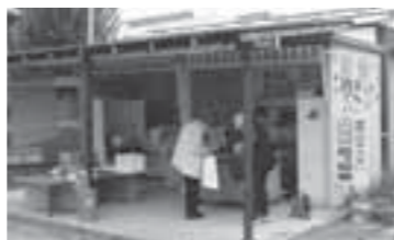
▲本郷店(旧国道113号角田街道踏切そば)