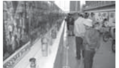
●写真上段/こけしの実演販売 ●写真中段/段ボール製の甲冑試着体験 ●写真下段/会場内に設けられた「こけしコンクール歴史通り」

5年ほど前から並び始めました。今回も、お目当ての品を手に入れることができましたので、とても満足しています。デザイン関係の仕事をしており、こけしから感じ取れる木の良さや、その造形美に魅力を感じています。これからも一早く会場に行きたいと思えます。