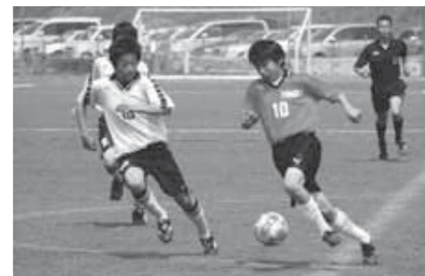
▲勝利を信じて、必死にボールを追いかける選手たち

4月26日・27日・29日の3日間にわたり、白石川サッカー公園で第8回中学生サッカー交流大会が開催され、県南から参加した12校が、優勝を目指して熱い戦いを繰り広げました。この大会は、交流を通して各校のレベルアップを図ろうと、白石サッカー協会が主催したものです。予選ブロックの1位チームのみが、最終日の決勝トーナメントに進めるという厳しい戦い。残念ながら本市のチームはすべて予選で敗退してしまいましたが、6月中旬の中体連サッカー大会に向けて、関係者は着実に各校の実力が伸びてきていることを実感していました。