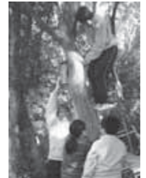
▲見事なチームワーク！