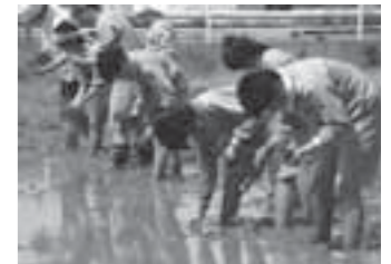
▲一生懸命苗を植える生徒たち