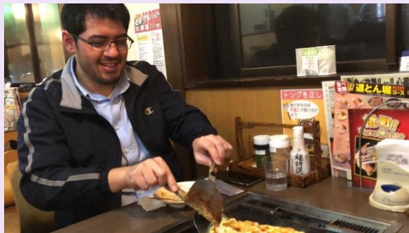
▲大好物のお好み焼きを焼いています…。「焼けたかな？」

宮城県に住んで約4年、白石での生活や仕事に期待に胸をふくらませています！いつかみなさんに会えることを楽しみにしています。