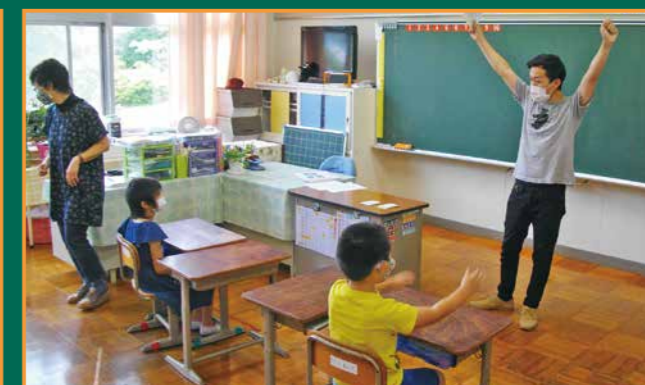
▲ALTと一緒に英語で歌う児童