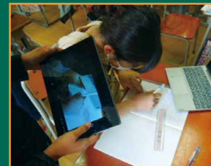
▲合同な図形の描き方を撮影し合う様子の読み聞かせをしています