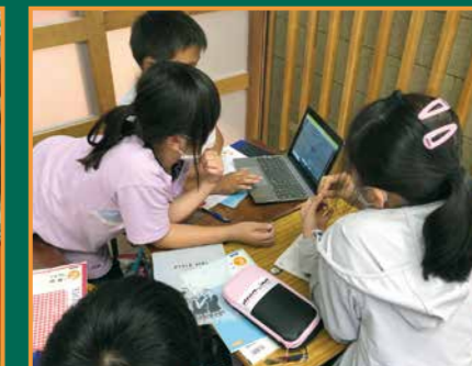
▲タブレットを見ながら話し合いをする児童