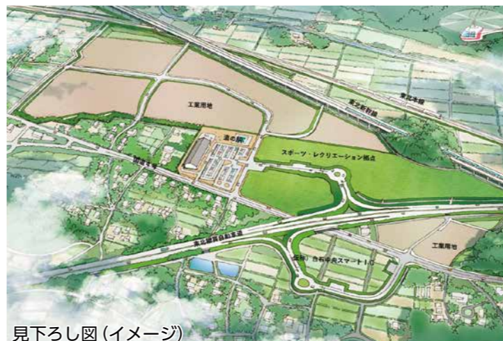
見下ろし図(イメージ)

今後、産業活性化の新たな産業 拠点(工業団地)、賑わいと活力あ ふれる新たな交流拠点となる「道 の駅」および健康で生きがいを持