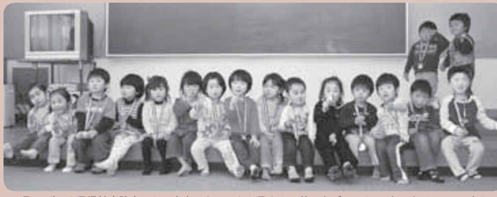
※4月の3歳6カ月児健康診査から、虫歯のなかったお子さんに差し上げていたメダルが、シールに変わります。