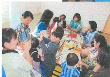
令和元年度開催の様子