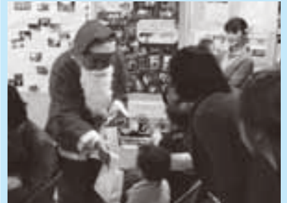
▲会の終わりにはサンタさんも登場！

▲楽しく遊ぶ参加者たち 会場中央に設けられたステージでは、ファミサポ提供会員によるクリスマスのお話や絵本の読み聞かせのほか、参加者がグループごとに分かれて輪唱、体操、寸劇、手話を交えながらの歌の発表などが行われました。クリスマス一色に染まった会場で、親子一緒に楽しいひとときを過ごしました。