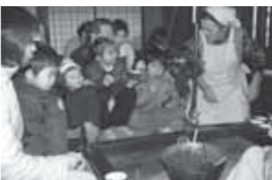
▲おいしそうに食べる子どもたち

武家屋敷恒例行事「節分の会」 無料入場券(家族・グループ可) (ただし、2月3日(日)に限る)