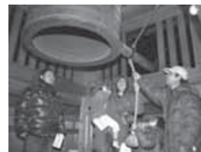
▲家族の無事と繁栄を願って

12月31日、白石城本丸内鐘堂で恒例の「除夜の鐘を鳴らす会」が開催されました。大みそかは雪が降る悪天候でしたが、開始から親子連れやカップルなど、たくさんの方が来場。