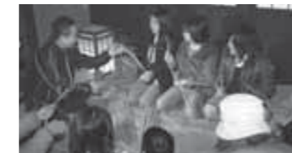
▲しめ縄作りを体験する参加者

その年の冬至に合わせて毎年開催している冬至の会には、約70名の親子連れなどが訪れました。白石市食生活推進委員会の皆さんの協力により用意された100食の冬至かぼちゃを、おいしそうに食べていました。また、12月26日には「お正月を迎える会」を開催。約100名が参加し、伝統のしめ縄作りを体験したほか、おいしい年越しそばを食べて新しい年に備えました。