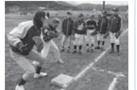
▲捕手の送球指導を受ける中学生

JR東日本東北野球部は、社会人野球全日本選手権でベスト4となる強豪。今にも雪が降りそうな寒さの中、参加した約150名の小中学生たちは、日本でトップクラスの野球チームの皆さんから熱心な指導を受け、寒さも忘れて守備や打撃などの練習に打ち込んでいました。