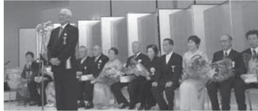
▲1月7日に開催された「新春を寿ぐ市民の集い」

平成19年春・秋の叙勲、危険業務従事者叙勲、褒章で、各分野における功労者として10名の方が晴れの受章の栄に浴されました。1月7日にパレスリゾート白石蔵王で開催された「新春を寿ぐ市民の集い」において、受章された方々の栄誉をたたえ、約450人の参加者が受章を祝いました。