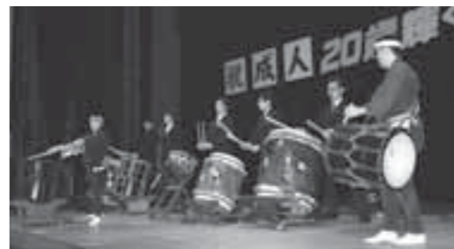
▲今年は、和太鼓グループ「幻創」の演奏に新成人の皆さんが参加