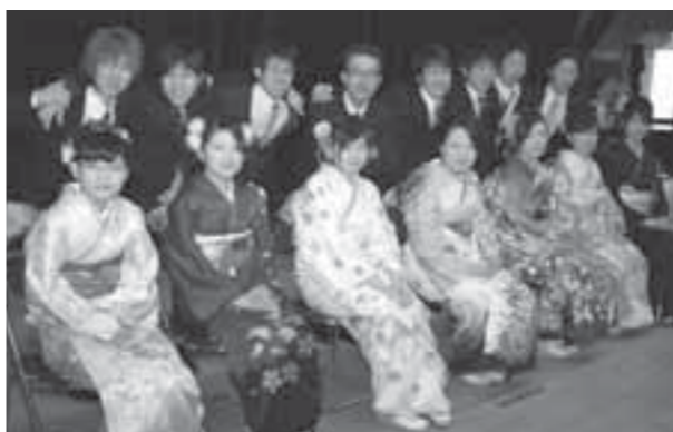
▲成人式の企画運営に携わった実行委員の皆さん