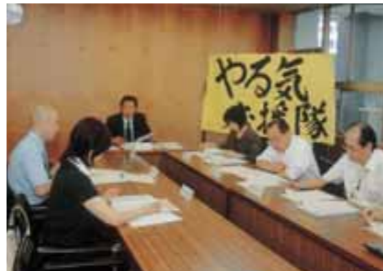
▲補助金審査会・やる気に応えるため熱心に審査