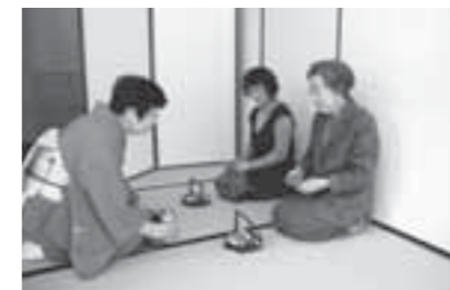
▲まずは一献! お正月気分満点

また、1月20日には新春茶会が行われました。参加者はおめでたい雰囲気の中で抹茶をいただきました。また、お正月ということで一献振る舞われ、ゆったりと初春のお茶を楽しみました。