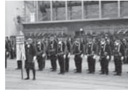
▲団長訓示を聞く団員の皆さん

1月6日、毎年恒例となった消防出初式が、ホワイトキューブで開催され、620名の消防団員の皆さんによる点検作業など、日ごろの訓練の成果を披露しました。