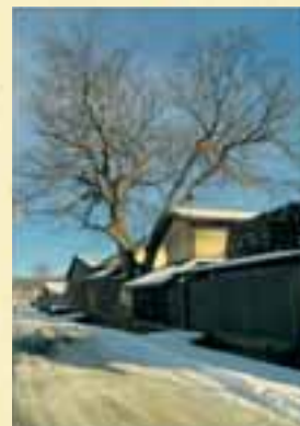
「倉と巨木(げやき)」 (撮影場所:城北町地内)

2月は 介護保険料(6期)、国民健康保険税(8期)の納期です 「夜間収納総合窓口」開設(市で取り扱うすべての税金・料金の納入) 仕事などでお忙しい方、ぜひご利用ください。 ●日時 2月27日(水)・2月28日(木)、17:30~19:30(市税は17:30~20:00) ●場所 市庁舎1階 収納管理室ほか