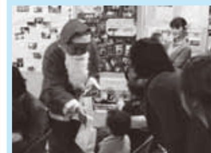
▲会の終わりにはサンタさんも登場！

会場中央に設けられたステージでは、ファミサポ提供会員によるクリスマスのお話や絵本の読み聞かせのほか、参加者がグループごとに分かれて輪唱、体操、寸劇、手話を交えながらの歌の発表などが行われました。クリスマス一色に染まった会場で、親子一緒に楽しいひとときを過ごしました。