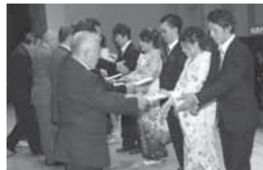
▲式典では、新成人たちに記念品としてオリジナル図書カードが贈られました。