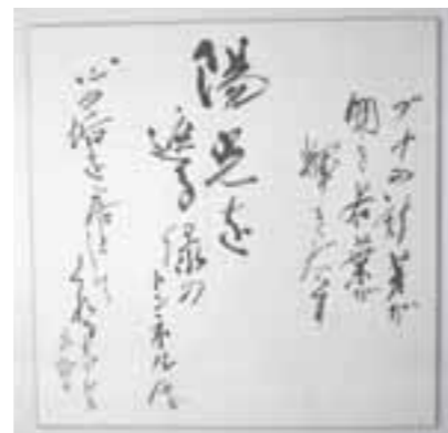
▲完成までに5カ月を要した受賞作品の「若葉」。大きさが1.2m四方と、文字通り大作です!