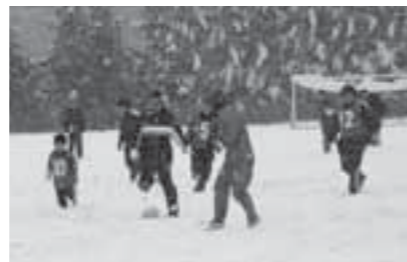
▲世代を超えてサッカーを楽しみました

今年で40回目を迎える白石サッカー協会主催の「けり初め」。子どもから大人まで40名が参加し、雪で悪戦苦闘しながらも、全員でボールを追いかけていました。