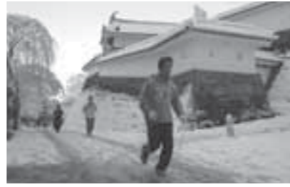
▲元旦を気持ちよく走り抜く参加者

白石高校陸上競技部OB会が主催する恒例の元旦マラソン。今年も、同校のOBや家族連れなど約60名が参加し、一周2.5キロのコースを走り抜け、全員が完走しました。