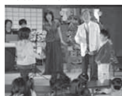
▲昨年のおまつりでは、全員で楽しく「大きな古時計」を熱唱しました!

●申し込み、問い合わせ先 白石まちづくり(株) ☎25-6054 ☎25-6227