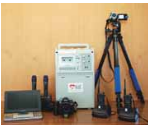
▲貸し出し備品の数々