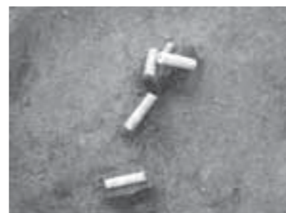
▲お墓から発見された管玉

このほか、発掘調査では弥生時代に埋没した川の跡や生活道具などを含む地層が発見されたほか、当時の植物が腐らずに残っていた地層も発見されました。