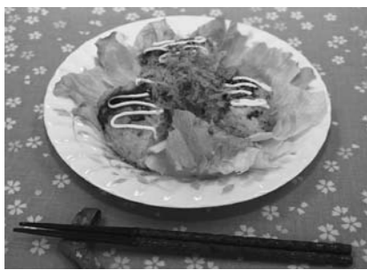
エネルギー298kcal / たんぱく質10.7g / 塩分0.7g