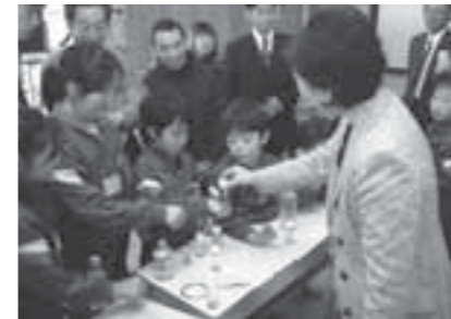
▲酸性雨の説明を受ける児童たち

本市と蔵王町の国際環境規格取得企業8社でつくる白石蔵王エコフォーラムが、12月14日に大鷹沢小学校で出張環境講座を開催しました。