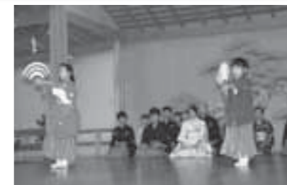
▲「子ども能楽教室」の発表の様子

その後、定期講座の一つである「高砂を謡う会」の皆さんの発表会をはじめ、伝統芸能振興会の各団体の皆さんが、神楽や謡曲、日本舞踊や箏曲、長唄などを次々と披露。昨年10月から実施している「子供能楽教室」の子どもたちも、日ごろの練習の成果を披露しました。