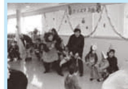
▲楽しく遊ぶ参加者たち

昨年12月19日、ふれあいプラザでファミリー・サポート・センターと子育て支援センター共催のクリスマス会を開催し、たくさんの親子に参加いただきました。