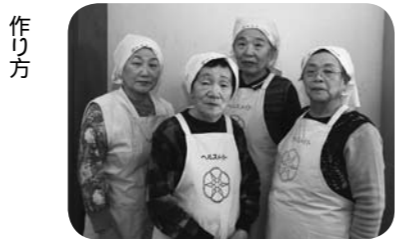
ヘルスメイト白石 白石地区の皆さん