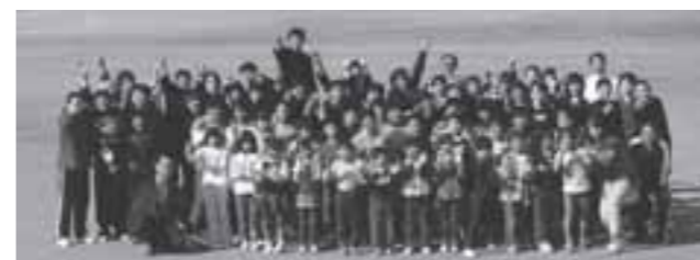
▲児童、生徒、教職員全員で温かくお迎えします

■住所：白石市小原字伊勢原道上1番地 小原小学校 ☎29-2026 ☎29-2057 http://www.obara-e.myswan.ne.jp/ 小原中学校 ☎29-2027 ☎29-2078 http://www.obara-j.myswan.ne.jp/