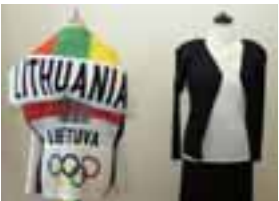
▲92年バルセロナオリンピックのリトアニア選手団のコスチューム(写真左)とISSEY MIYAKEの婦人服

布を対象にしたものづくりですので、きめ細やかな配慮が必要です。裁断、加工、検品と、それぞれの部門で社員が機械や自身の目を相手に頑張っています。私も含め、全員が布に携わるこの仕事が好きなんです。そして「良いものを作る」という統一