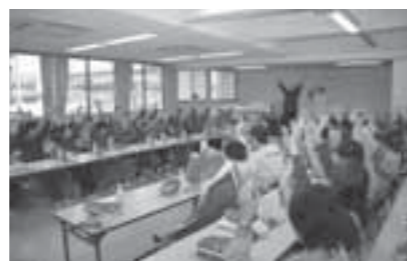
▲楽しく交流する参加者の皆さん

今年で11回目を迎えた、園利用者と地元南町の自治会員でつくる「ボランティアみなみの会」の皆さんの交流会。歌やゲームなどで楽しいひとときを過ごしました。