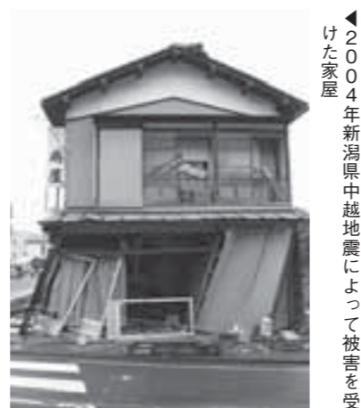
◀2004年新潟県中越地震による被害を受けた家屋

全を考える」 ●主催 宮城県白石工業高等学校、宮城県建築士会白石刈田支部、白石市 ●申し込み方法 電話またはファックスで、2月12日(火)まで氏名・人数を下記までご連絡ください。 ・宮城県白石工業高等学校 ☎25-3240 ☎25-1476 ・建設課建築住宅係 ☎22-1326 ※市民講座を出前します。自治会または自主防災組織単位でご相談ください。 ◎建設課建築住宅係 ☎22-1326