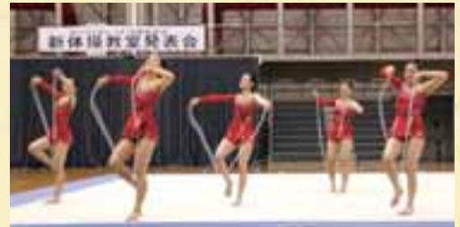
▲聖和学園高校の素晴らしい演技