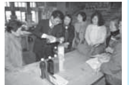
▲米のとぎ汁でEM発酵液を作る講習

12月20日、いきいきプラザで市地域婦人団体連絡協議会の皆さんが、EMの勉強会を開催しました。