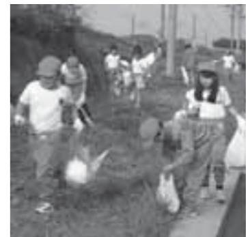
▲地域内を清掃する斎川小の児童たち