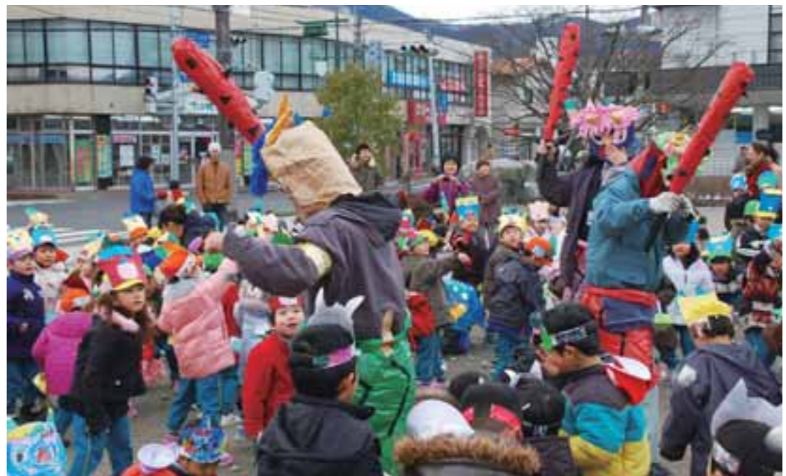
▲昔・むかしを伝える会が例年開催している「豆まき大会」。やる気応援隊も鬼にふんして出動！（平成19年2月、すまいるひろば）

本市では、地域づくりを支援する「やる気応援事業」を実施しています。 やる気応援隊（生涯学習課）は、5つの応援歌（やる気応援事業）で、地域づくりに貢献する「やる気」のある団体（やる気隊、自治会などのコミュニティ団体）を応援します。