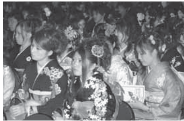
▲鮮やかな晴れ姿で式典に出席する新成人の皆さん。今後のご活躍が期待されます。

1月13日、中央公民館で平成19年度の成人式が開催され、会場は晴れ着や真新しいスーツに身を包んだ若者たちの笑顔でいっぱいになりました。本年度新たに成人を迎えたのは、昭和62年4月2日から昭和63年4月1日までに生まれた445名の皆さん。式典では、風間市長をはじめとする来賓の方々が新成人の代表者に記念品を贈りました。式典後のアトラクションでは、今年も和太鼓グループ「幻創」が力強い演奏を披露。20歳の門出を祝ったほか、「大人として社会に貢献したい」という新成人自らの意志として募金が行われ、集まったお金は社会福祉活動に役立ててほしいと、NPO法人白石うぐいす会に贈られました。