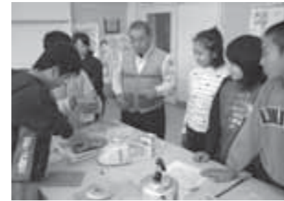
▲はがき作りに取り組む児童たち

第一小学校で12月中旬に、使わなくなったチラシからはがきを作るリサイクル教室が学年ごとに行われました。この教室は、子どもたちにリサイクルの大切さを学んでもらおうと行われたもので、出来上がったはがきは、交通安全を呼び掛ける「さくらメール」に使われることになっています。12月10日は、6年生が体験。いきいきプラザの職員の説明を受けながら、楽しくはがき作りに取り組んでいました。