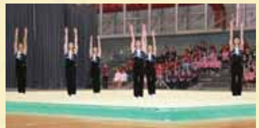
▲本市出身者が4名いる青森山田高校の演技