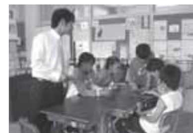
▲中学校教師と担任教師による小学生への算数の指導

学校行事では、一人で何役も仕事をしなければならぬこともありますが、パワー全開で一人ひとりがまぶしいくらいに輝く活動をしています。