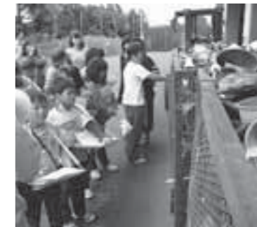
▲仙南リサイクルセンターを見学する白川小の児童たち