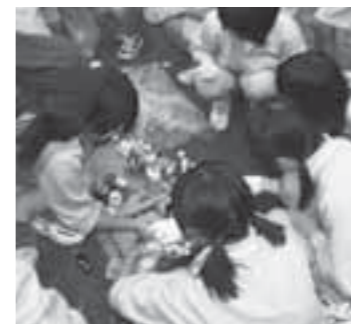
▲回収したごみの分別を行う白川中の生徒たち