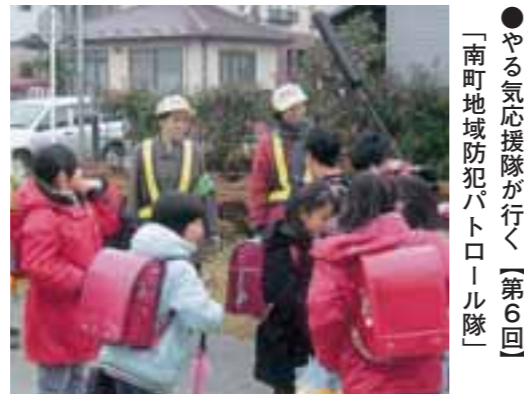
▲毎日、子どもたちを見守っています！

やる気隊の活動をはじめ、市民のやる気を広報し「やる気応援情報掲示板」などで紹介していきます。皆さまのやる気、または周りで見掛けた小さなやる気をご紹介ください。やる気応援隊が駆け付けます。