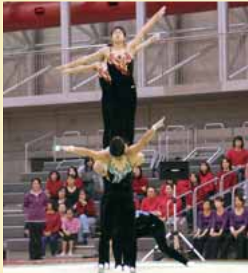
▲盛岡市立高校のダイナミックな演技を披露