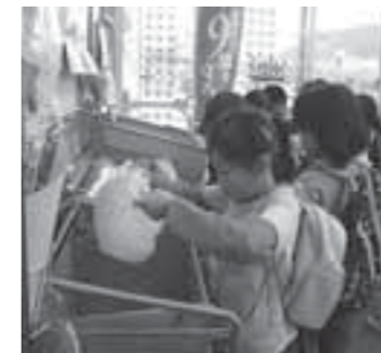
▲スーパーマーケットの分別コーナーでの体験学習を行う大鷹沢小の児童たち