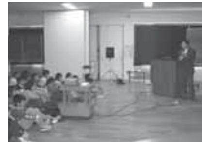
▲スライドとビデオで分かりやすく説明

同フォーラムでは、環境問題の深刻さを子どもたちに伝えようと、小学校などで出張環境講座を開催しており、昨年も第一小学校や白川小学校で実施しています。この日は、同小学校の3・4年生など約50名が参加。酸性雨や発電体験コーナーなどで環境問題の大切さを学びました。