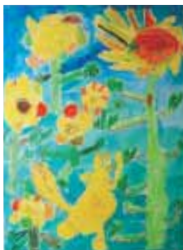
「花いっぱいになあれ」