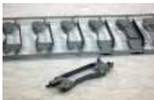
▲各方面から高い評価を得ている金属部品

また、昨年12月には親会社のクラリオン(株)が日立グループの傘下に入りました。将来、日立の広範囲な技術力を取り入れた新製品の部品供給が可能になるものと期待しています。