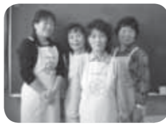
ヘルシーな白米 白川地区の皆さん