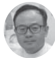
公立刈田総合病院 整形外科