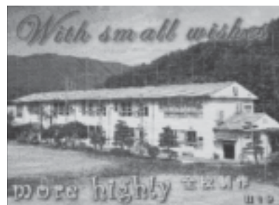
▲全校制作「私たちのまなびや モザイク壁画」

本校は、平成20年8月に新校舎が完成する予定です。先日行った文化祭「南中祭」が、今の木造校舎で行う最後の文化祭でした。南中の歴史が大きく変わるこのときに、「歴史あるこの木造校舎を忘れてほしくない」、「大切にしたい」という気持ちが生徒たちにわいてきました。それを形に表したのが全校制作「私たちのまなびや モザイク壁画」です。1枚が2cm×2cmの色紙を全校生徒で分担し、10m×8mの作品を仕上げました。家に持ち帰って作業をしなければならない生徒もいて、保護者の方や祖父母の皆さんの協力もいただいたようです。「全家庭制作」と言ってもいいかもしれません。