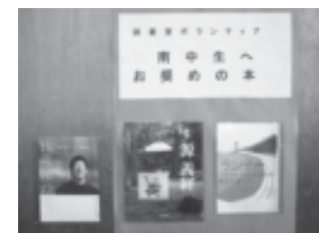
▲中学生へお勧めの本

本校には地域ボランティアとして、図書ボランティアの方々や書写指導をいただいている方がいます。特に図書ボランティアの方々には、行き届かなかった図書室環境の整備や蔵書の整理、中学生にお勧めの書籍の紹介などを月に2回程度行っていただいています。朝読書を推進している本校にとっては、大変心強い方々です。また、本校は学校開放で校庭や体育館を活用していただいています。日曜日の早朝に、校庭で練習をしているソフトボールチームの方々、練習が終わると校庭を整備したり、除草したりしてくれます。週の初めには、大変気持ちいい校庭が、私たちを迎えてくれます。こちら本校を支えてくださっている地域の方々です。このような暖かい人々に囲まれて、生徒たちは伸び伸びと学校生活を送っています。