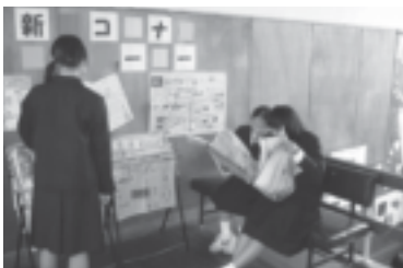
▲昼休みの新聞コーナー

国語や社会の授業でも、新聞から情報を得ながら調べ学習をしています。また、学習のまとめとして新聞を作成することもあります。このNIEの取り組みにより、生徒たちの情報活用能力の育成が図られつつあることも実感しています。