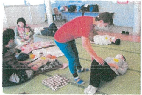
子育て支援センターで行った時の様子