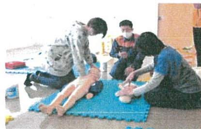
昨年の受講の様子