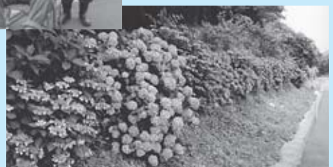
▲国道4号沿いに植えられたアジサイ