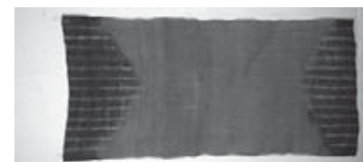
▲制作予定のタペストリー(見本)

秋の自然の優しい色で染め上げます。 ●制作作品 「山桃で染めるタペストリー(絞り染め、40cm×150cm)」