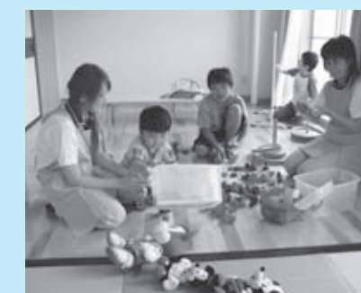
▲託児の様子(薬師の湯4階託児室)