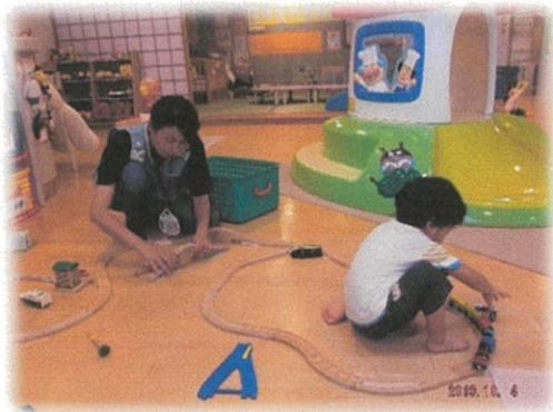
やんちゃっこでの援助活動の様子