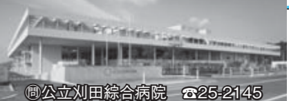
☎公立刈田総合病院 ☎25-2145