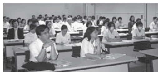
▲院内研修会の様子

今回は「NST(栄養サポートチーム)」に関する特別講演が行われ、当院で働く各職種約70名の職員が参加してほかの病院の取り組みの現状や今後の課題などを学ぶことにより、NSTの意義や必要性を再認識しました。