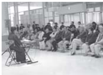
▲刈田病院のロビーで開催されたコンサートの様子