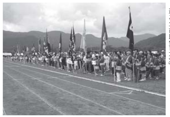
▲より楽しめる大会を目指し、今年で79回目を迎える「市民体育大会」