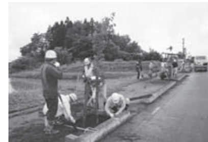
▲植林作業を行う参加者たち

6月1日、白石市管工事業協同組合と白石市排水工事業組合に加盟する事業者の皆さんが、水道事業所と協力して総合福祉センター近くの市道にオオヤマザクラの苗木を植樹しました。