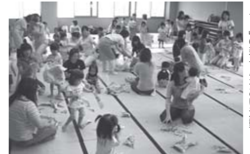
▲古新聞紙を活用した「ほっぴんちよ」の親子ふれあい活動

いう保護者の気持ちを大切に、一人で悩まず子どもの気持ちに寄り添いながら楽しく子育てしていく、親子一緒に参加できる学習会です。運営は子育てサポーターや託児ボランティアの皆さんが行っています。