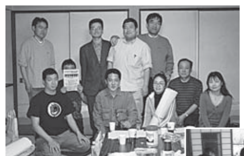
白石和紙あかり製作ワークショップの様子