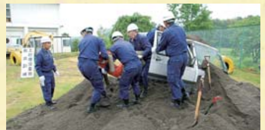
▲土砂に埋もれた車両からの救出救護訓練