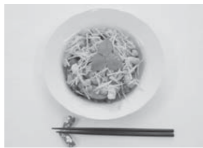
エネルギー142kcal / たんぱく質3.3g / 塩分0.4g