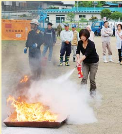
▲住民による初期消火訓練