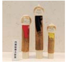
▲受賞作品「春の風について」。原木を生かした自然な作風が高く評価されました。

また、来年こけしコンクールは50回の節目を迎えます。これを契機にもっと白石がにぎわうよう、地元の工人として応援していきたいと思っています。これからも良い作品ができるよう頑張りますので、温かく見守っていただければと思います。