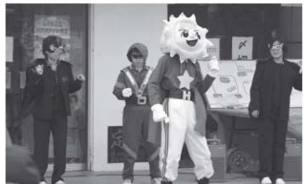
▲「子どもまつり」に仮装して登場したジュニアリーダーの皆さん