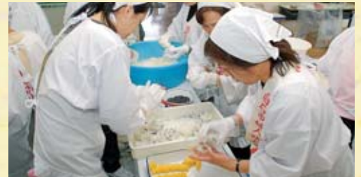
▲婦人防火クラブによる炊き出し訓練