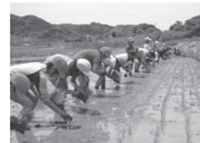
▲楽しく田植えを行う児童たち

同小では、「みやぎらしい協働教育推進事業」のモデル指定を受け、地域住民が指導者となりさまざまな体験学習を行うコラボスクールを実施しています。この日は地元農家の皆さんの指導を受けながら、3アールの水田に1列になり、秋の実りを楽しみにしながら、ひとめぼれの苗を一本一本丁寧に植えていきました。