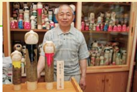
▲受賞作品と一緒に。後ろの棚にはこれまでの作品がぎっしりと並びます。