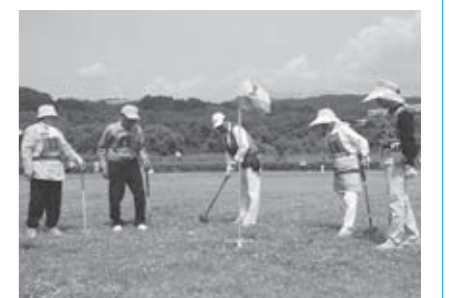
▲晴天下、楽しくプレーする参加者の皆さん

熱戦の末、団体では深谷南チームが昨年に引き続き優勝したほか、長町福寿会Aチームが準優勝、本郷第三千歳会チームが3位となっています。