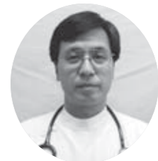
公立刈田総合病院 呼吸器科

あります。SASの代表的な症状は、激しいいびき、睡眠中の呼吸停止、昼間の眠気です。全身倦怠感、熟睡感の欠如、窒息を伴う覚醒、起床時の頭痛や口腔内乾燥、集中力の低下などもあります。 もし症状がありましたら、当院呼吸器科を受診してください。必要があれば入院 (1泊2日) していただき、検査を行います。治療は軽〜中等度では、生活習慣の改善、側臥位就寝、歯科装置 (マウスピースのようなもの) などを、中〜重症では、鼻にマスクをかけ、機械で持続的に空気を送り込むCPAPという装置を勧められています。