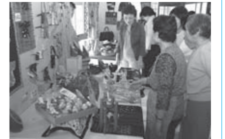
▲思わず手にしたくなる商品の数々

5月26日、27日の2日間にわたり、今回で3回目となる手づくりの市が寿丸屋敷で開催されました。