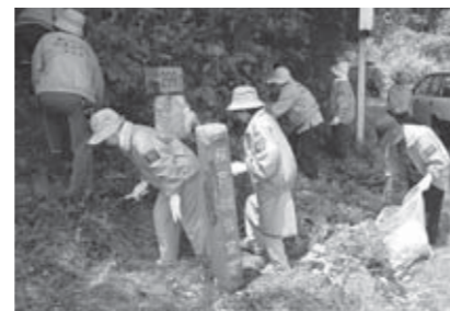
▲ごみはもちろん! 草刈りまで

6月11日、斎川地区の国道4号沿いにある桜戸観音堂で、婦人ボランティア団体の「やまぶき会」の皆さんが清掃活動を行いました。