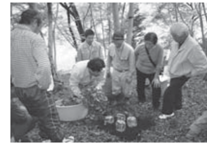
▲落ち葉マウンド法による栽培実習

5月31日、白川犬卒都婆地区において「ムラサキシメジ栽培技術研修会」が開催され、仙南地域の農家33名が参加しました。