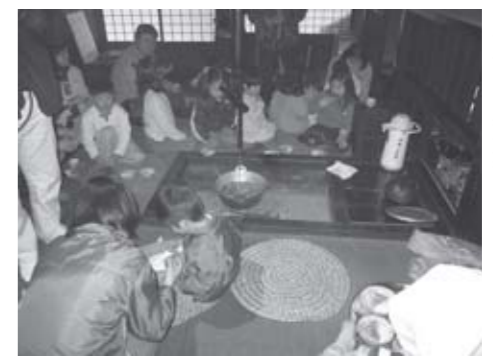
▲端午の節句展で作りたての巻き寿司を味わう参加者