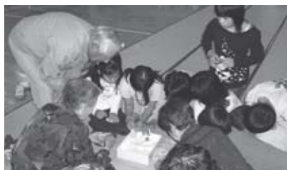
▲交流活動「昔の遊びを教わろう」

特に、深谷公民館との連携事業として行っている高齢者との交流活動(ふれあい活動)は年2回実施しています。1回目は高齢者の方々から昔の遊びを教わる活動、2回目は児童がパソコン操作を教える活動を行っています。年2回ですが、毎年回を重ねるに従って児童と高齢者の方々の心のふれあいが深まっていく様子が見られます。