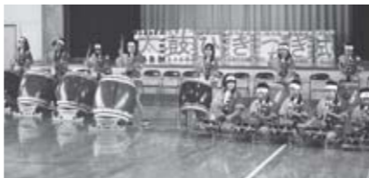
▲深谷小の伝統となっている「かさまつ太鼓」

組み目標や指導の具体的な手立て)をお知らせし、それを基に学校の教育活動を評価していただくという取り組みを行っています。