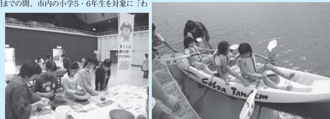
▲昨年のわんぱく少年教室の様子。(左)気分はスッカリ陶芸家!? (右)夏の海でドキドキカヌー体験