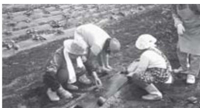
▲落花生の苗植えを教わる児童たち

また、3年生は「食育」の一環として、農協青年部や女性部の皆さんからご指導をいただき、稲作や野菜栽培に取り組んでいます。活動を通して児童は食の大切さや働くことの喜びを学んでいます。