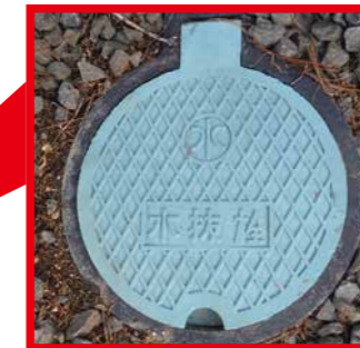
▲屋外に設置してある水抜栓。いろいろな種類・設置場所があります