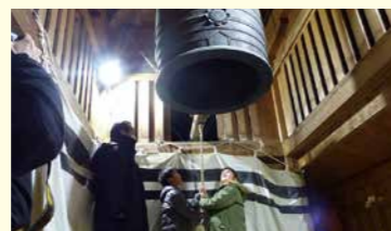
▲今年最後の思い出にいかがですか