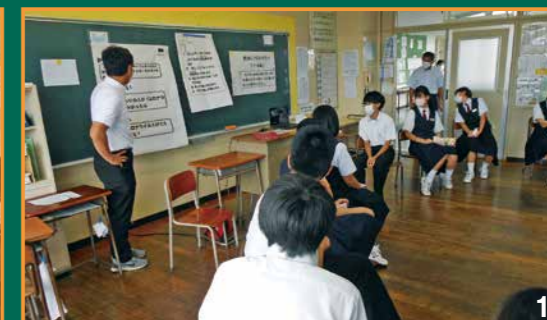
① 新型コロナによる差別を考えさせるp4cの授業 ② 学習指導員の先生と一緒に真剣に問題に取り組む様子