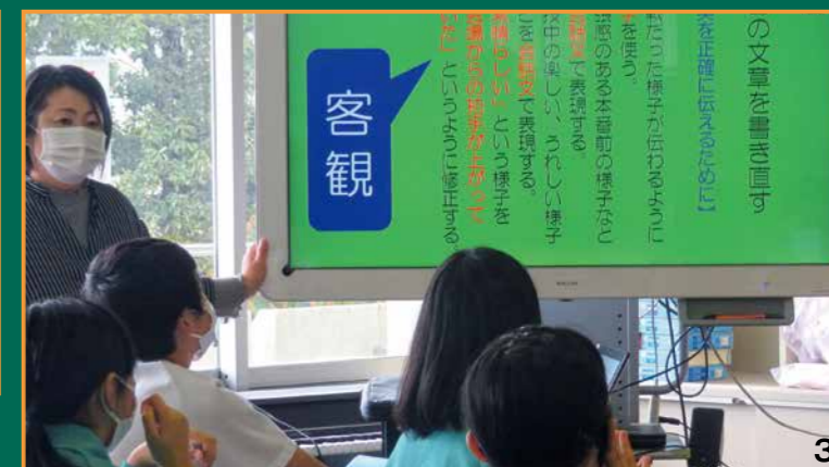
③ 文章を書く際のポイントを明確にした授業 ④ 優れたモデルを示すための作品の掲示