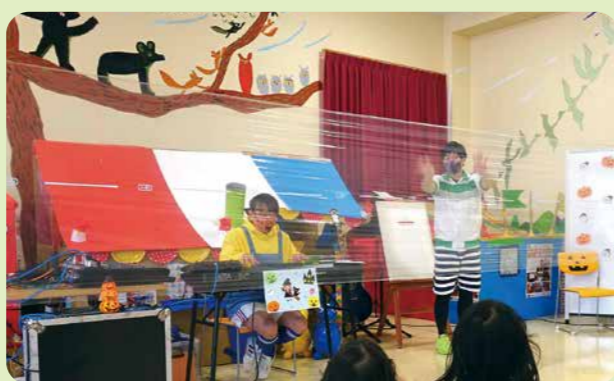
▲10月の親子で楽しむシアター・シアター

あきらちゃん&ジャンプくんは、全国の保育園、幼稚園でも大人気！パネルシアター、ぶらぶらシアターは座ったままでも楽しいよ！