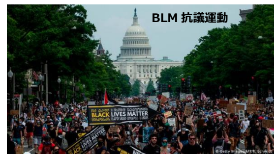
▲Black Lives Matter (BLM) アフリカ系アメリカ人に対する白人警察の残虐行為をきっかけに始まった人種差別抗議運動