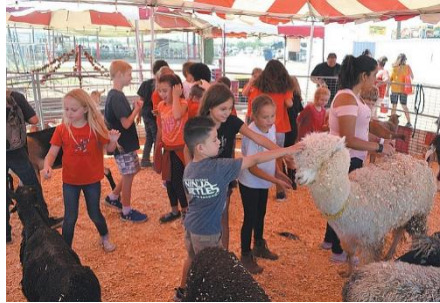
▲農業祭での動物とふれあうコーナー

南部の文化でも一つ大きなものは、見本市とロデオです。見本市はお祭りと説明したらいいかな。ロデオは雄牛や馬に乗っていろいろしかけて時間を競うショーです。私は一度も観に行ったことはありませんが、南部の人たちにとってはとても楽しいイベントです。