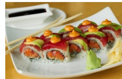
▲アメリカのお寿司

私がアメリカのことで本当に楽しんでいることは料理です。たとえアメリカのどこにいても、たくさんの種類の料理があって選べます。自分が食べたいと思う料理のレストランを簡単に見つけることができます。この国は移民によって創り出されたので、たいていは、遠い国の料理を見つけるのは非常に簡単です。もしみなさんがベトナムのフォー、中国のチャーハン、キューバのシュラスコ、ジャマイカのジャークチキン（ジャマイカ版チキンバーベキュー）などを食べたいときは、遠くまで行って食べる必要はありません。