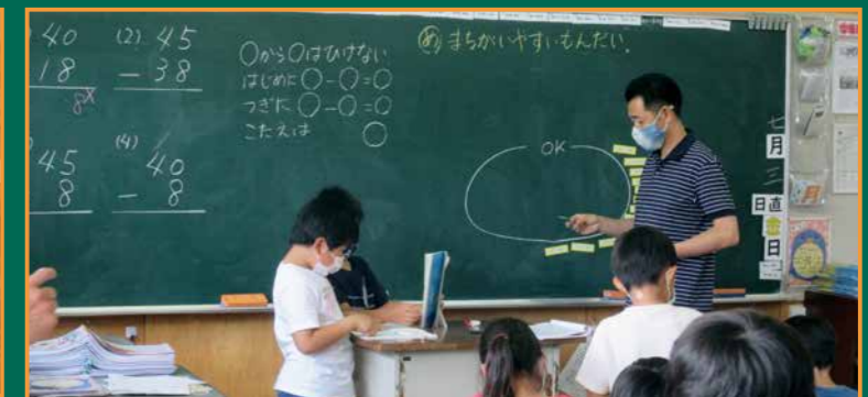
③ 子どもたちの考えをもとに、問題を解決します ④ お互いの考えを説明し合います