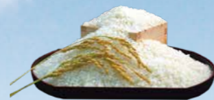
▲白石産の新米が勢揃い

みのりの体験祭り 11月14(土)・15日(日) 10時~16時 みのりガーデンで「クレープ焼き」や「ミニしめ飾り」、「ソフトワイヤーでかご作り」など、地域のプロフェッショナルの体験コーナーを開催します。 また、姉妹都市の食材を使ったみのりのシェフによる限定メニューを用意してお待ちしています。 地場産品加工の「みのりファクトリー」食品検査などの「みのりラボ」の見学ツアーも開催しますので、皆さん、ぜひご参加ください。