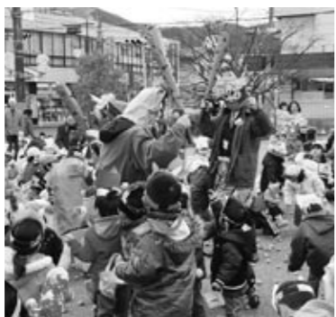
▲2月1日に行われた豆まき大会

また、2月1日には節分にちなみ、すまいるひろばで「豆まき大会」を開催しました。袴姿のスタッフと元気な子どもたちが、必死に豆をまいて鬼を退治するなど、全員で楽しい時間を過ごすことができました。