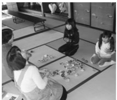
▲お手玉遊び。笑顔が絶えません！

この日は竹とんぼ以外にも、昔懐かしいお手玉遊びや紙芝居、おやつに振る舞ったおしるこなどで、子どもたちに貴重な体験をさせてあげることができました。