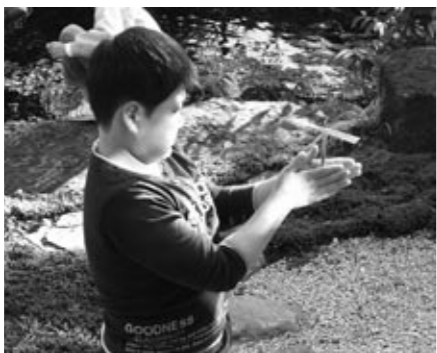
▲竹とんぼ遊びに夢中になる子ども

昨年11月には市内の小学生や幼児を対象に、壽丸屋敷で竹とんぼの作り方を伝授。なたやのこぎりに触れるのは初めてという子どもたちに、竹を切る作業から仕上げまで、一つひとつ教えていきました。やつと出来上がった竹とんぼに子どもたちが胸を躍らせる姿を見たときは、私たちも非常にやりがいを感じたことを覚えています。