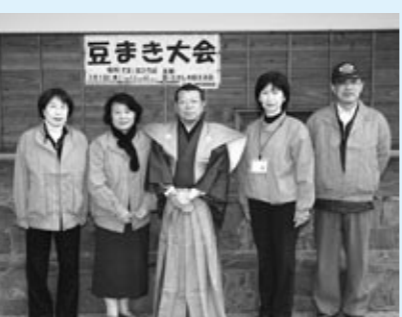
▲会の皆さんです。今後も頑張ります！

昔から伝えられてきた楽しい遊びや伝統行事、日常の食べ物、生活の知恵など、こんなことやあんなことも伝えたい、伝えてほしいという思いで活動しています。作って遊ぶ竹とんぼや、お手玉・紙芝居はとても好評をいただきましたし、節分にはすまいるひろばで子どもたちが元気に豆をまいてくれました。