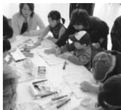
▲昨年11月4日、白石市農業祭で子どもたちも「NOレジ袋!マイバッグ作り」を行いました。