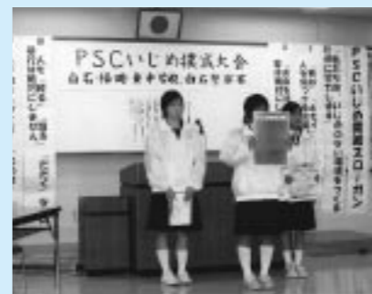
▲いじめ撲滅のポスターを披露する隊員

12月6日、白石中学校、東中学校、福岡中学校の生徒でつくる自主防犯隊「PSCパトロール」の皆さんが白石警察署で「いじめ撲滅大会」を開催しました。この大会は、いじめのない環境を実現したいと、生徒自らが企画・立案したものです。 大会には隊員のほか、市の教育委員会や白石警察署の関係者など約60人が出席。『「死ね」』『キモイ』などの人を傷つける言葉を言わない』、『いじめがあったら『見て見ぬふり』は絶対にしない』といった6項目の大会スローガンが発表されました。