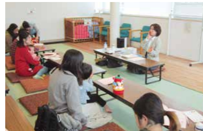
▲昨年の講演会「お家の整え方と時短料理」の様子