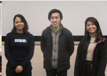
▲2020年2月市民との ALT英会話交流会