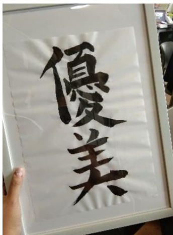
▲漢字。訪問した生徒の一人の名前“Grace”をイメージして・・・