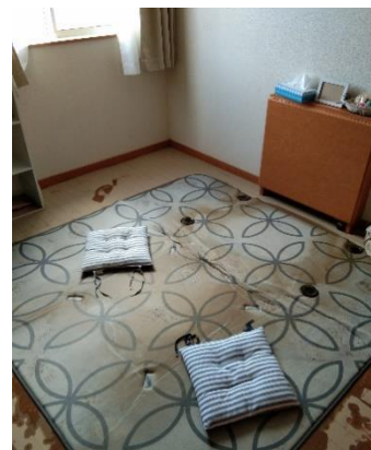
▲泥が乾いた後のアパートの部屋

This year was probably the hardest one for me. Aside from the fact that I had to leave my country and start living alone, my apartment was flooded during Typhoon 19, and now we're stuck in this COVID-19 pandemic. There were a lot of things that I lost and things that I couldn't do, but with all the support I got from all the people around me, I was able to overcome these struggles.