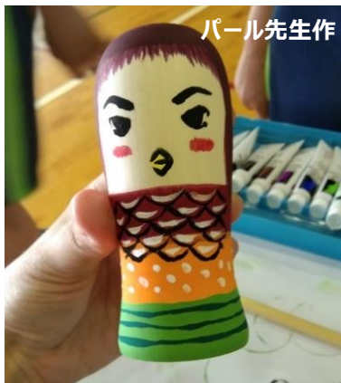
▲「アマビエこけし」制作体験@福岡中学校 1年生と制作。疫病退散の願いを込めて・・・。

I'm really sad to leave this place, but it's time for me to start a new chapter in life. Words can't express how much I'm grateful and indebted to all the people who made this year memorable and worthwhile. Shiroishi, and Miyagi as a whole, will forever have a special place in my heart. Take care, everyone, and see you all again!