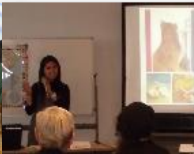
▲2019年12月の国際カフェで フィリピンを紹介