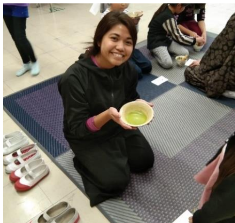
▲茶道のお稽古中@福岡小学校

However, I also enjoyed a lot of things during my stay here! I got to travel to other prefectures like Hokkaido, Niigata, Tochigi, and many more (all these happened before the pandemic!), but my best memory is my time with my students and co-workers in all of my schools. I enjoyed each day as I taught them English and some things about my own culture. I was always excited to come up with activities that will help them learn better and enjoy as well. I also joined some of their kurabu and bukatsu like the tea ceremony, and different sports teams. I also had my first calligraphy done at school. I spent Halloween and Tanabata with kindergarten schools, too, which made wearing costumes possible! Recently, I also painted Amabie on a kokeshi doll, along with my 1 st graders.