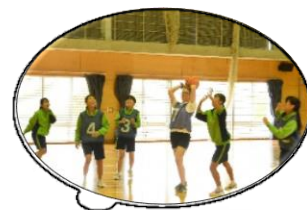
昨年10月にオーストラリアのカウラの生徒2名が福岡中学校を訪問しました。