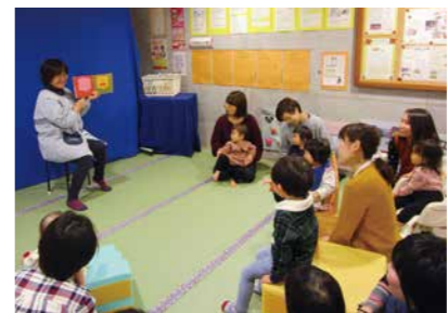
▲親子で読みきかせを楽しみました