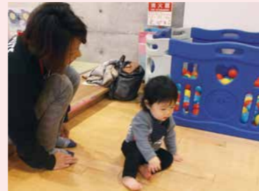
▲ふれあいプラザ内の「やんちゃっこ」で1時間半お預かり。ママのお迎えまで笑顔で遊びました

いつか私も子育てに一段落したときに、地域のママたちのサポートができたらと思いました。