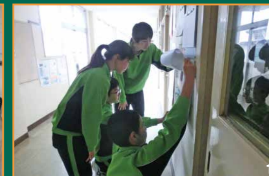
① 学プロの掲示板を見る生徒たち ② 放課後の学プロテストの様子