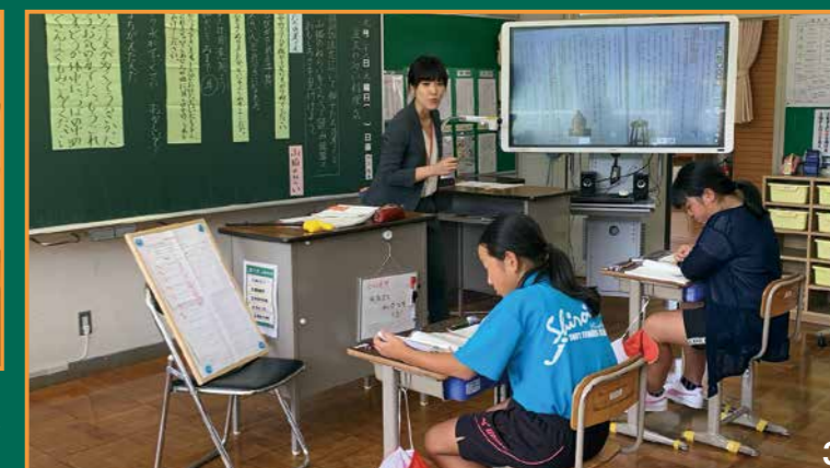
③ 「ねらい」から「振り返り」までを黒板やノートに残し、学びを可視化します ④ いつでも・どこでも・必要なだけタブレットPCを活用できます