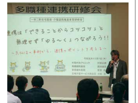
▲多職種連携研修会の様子

合病院で開催しました。医療職と介護職の方約100人が参加し、医療・介護のネットワークの大切さを再認識しました。 今後も協議会の理想像である「互いに助け合い、誰もが安心して、元気に暮らせるまち」の実現を目指し、在宅医療と介護の連携を深め、強化するための事業を進めていきます。 ☎健康推進課 ☎22-1362 長寿課 ☎22-1361 地域包括支援センター ☎22-1466