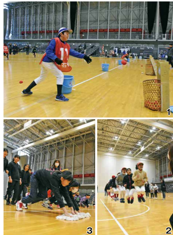
1_「玉入れ」はかごに玉が入ったら次の人へ！ 2_タイミングを合わせて「大縄跳び」に挑戦 3_2人の息が合わないと難しい「ぞうきん掛けリレー」

この日は選手だけでなく、運営を支えた指導者・保護者の皆さんも、普段とは違う仲間と接し、お互いの親睦と交流を深めていました。