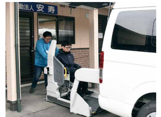
▲車イス利用者も安全に乗れる福祉車両

今回の訓練では、「避難準備・高齢者等避難開始」発令を想定して行われ、避難にかかる時間や通行ルートなどを確認しました。