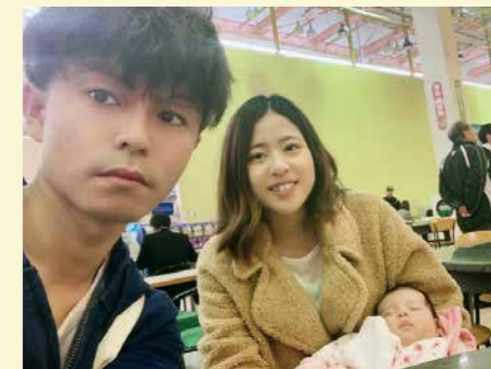
▲家族でお出掛けしたときの1枚

昨年子どもが生まれて、子育てに奮闘中です。仕事で疲れたときも、子どもの顔を見ると頑張ろうと思えますね。将来、自分で手掛けたマイホームを建てるのが目標です。