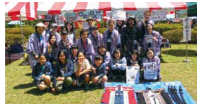
▲東北大学国際祭り参加の様子

http://www.city.shiroishi.miyagi.jp/soshiki/1/1246