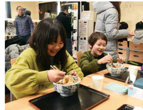
▲少しピリ辛な肉めしは子どもにも人気！