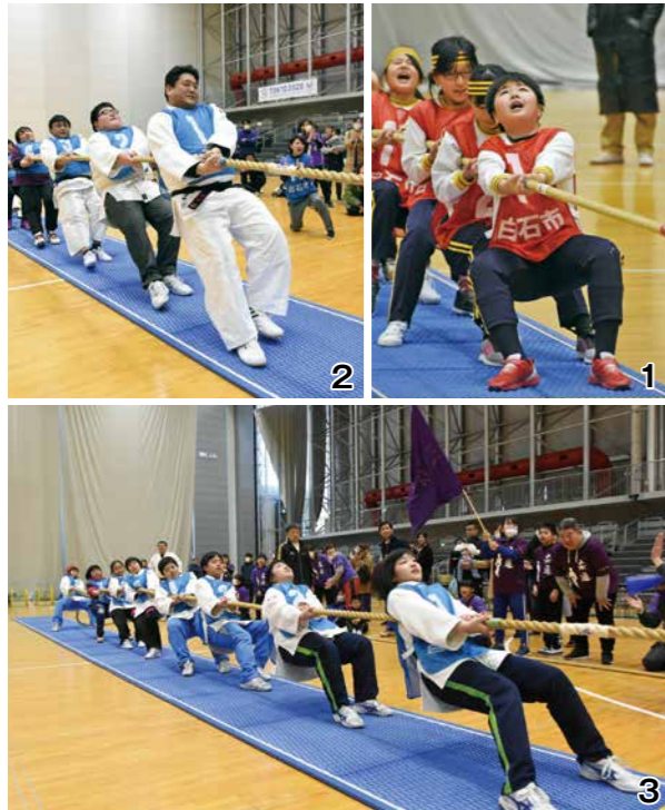
1_小学生の部で優勝した白一小「マスクで予防」チーム 2・3_一般の部と中学生の部を制した「白石三省塾柔道スポーツ少年団」チーム

優勝した白一小的児童は「声が出て姿勢も良かったので勝てたと思います。優勝できてうれしいです」と話していました。