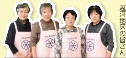
越後地区の皆さん