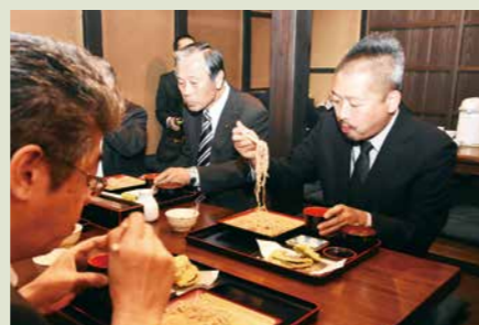
▲寒ざらしそばに舌鼓を打つ参加者

ソバの実を蔵王連峰の雪深い溪流に浸した後、寒風にさらし乾燥させた「寒ざらしそば」は、ほのかな甘みとつるつとしたのどごしが特徴。メニューは、ざるそば900円(税込)、ざるそばセット1,300円(税込)です。