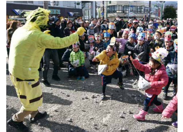
▲元気一杯に豆を投げる園児たち

ステージから「散らかし鬼」、「かぜひき鬼」、「おこりんぼ鬼」が現れると、子どもたちは元気に声を上げながら新聞紙を丸めた「豆」を投げ、心に住んでいる悪い鬼を退治しました。