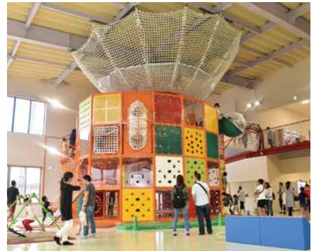
▲子どもが天候を気にせず安心して遊べる「こじゅうろうキッズランド」 【民生費】