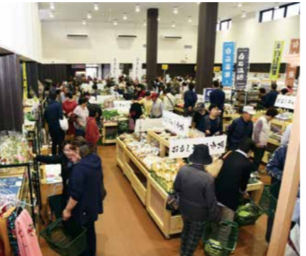
▲国道4号沿いにオープンした「おもしろいし市場」 【農林水産業費】