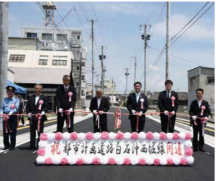
▲幅員が広がり駅前へのアクセスが向上した白石沖西堀線の開通式 【土木費】