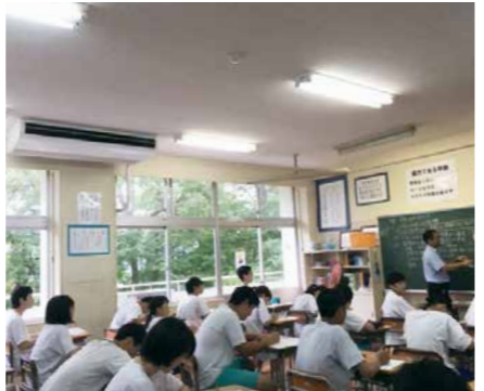
▲教育環境向上に向け、小中学校へのエアコン設置を進めました 【教育費】