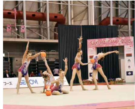
▲華麗な演技を披露したベラルーシ新体操ナショナルチーム 【総務費】