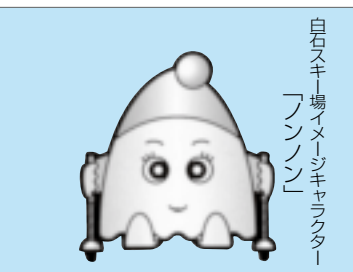
白石スキ場メージキャラクター「フノン」