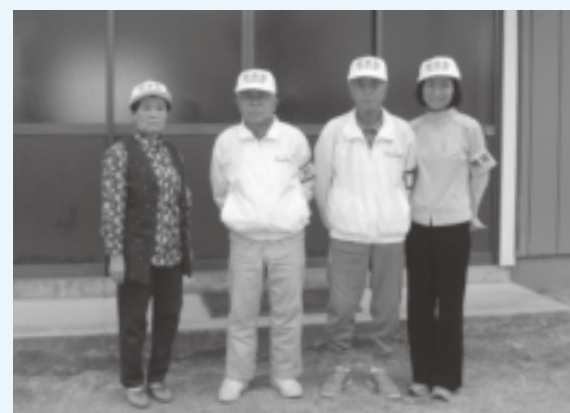
▲南町地域防犯パトロール隊の皆さん

補助金交付団体のご紹介 平成17年度やる気応援事業補助金(6月30日締め切り分) 交付団体の中から、今回は「南町地域防犯パトロール隊」についてご紹介いたします。 なお、交付団体については、市内ボランティア活動や各種事業にご協力をいただく際の「やる気隊名簿」に登録させていただいております。 【南町地域防犯パトロール隊】 この団体は、地区民有志42名で地域の防犯と児童の登下校の安全を守る一助になればと考え、今年度発足しました。 8つの班を編成し巡回曜日を割り当て、毎日パトロールを続けています。このたび、市の「やる気応援事業補助金」で防犯帽子を購入し、今はおそろいの帽子をかぶってパトロールをしています。 平日は児童の下校時間帯に合わせ、休日は午前・午後各自由に巡回時間を決めていきます。児童たちには「お帰り」、「気をつけて帰るんだよ」と声がけをしているので、児童たちも笑顔で手を振ったり、あいさつをするようになりました。学校や地区からも頼りにされています。継続は力なり。今後も無理なく続けていきたいと思っております。