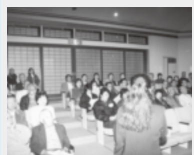
▲113自治会・約2,200人が懇談会に出席

今後30年の間に、宮城県沖地震が99%の確率で発生が予測されている中で、市民の皆さんの防災意識を高めるとともに、各地域での自主的な防災組織体制を確立するために開催されたものです。懇談会では、市で作成した防災マップなどを配布しながら、地域の防災に関する問題点について熱心に話し合いました。