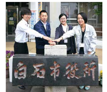
▲4月に入庁した新人職員