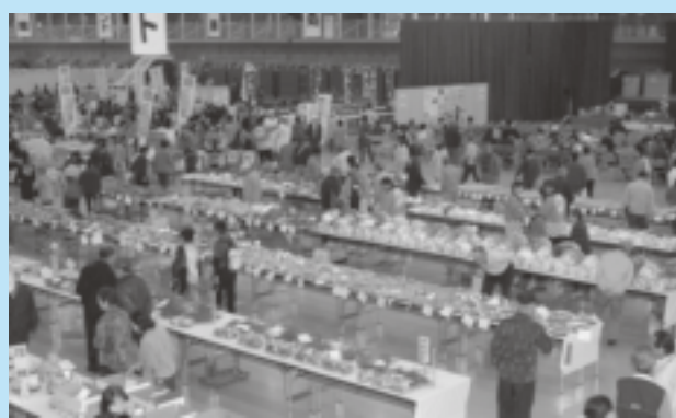
▲今年は2日間で延べ2万7千人が足を運びました。