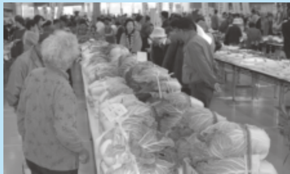
▲会場には所狭しと野菜がぎっしり!!