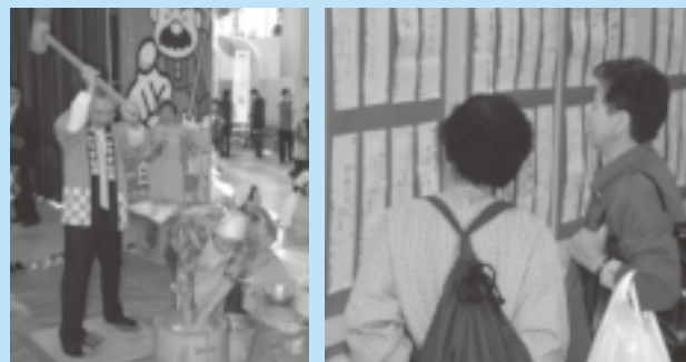
▲風間市長がんばって! ▲同時開催の書写絵画展