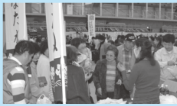
▲「越河の菜種油」販売コーナー。昨年同様好評でした。