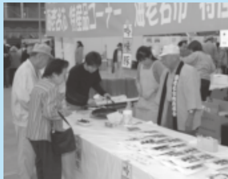
▲姉妹都市・海老名市の物産展