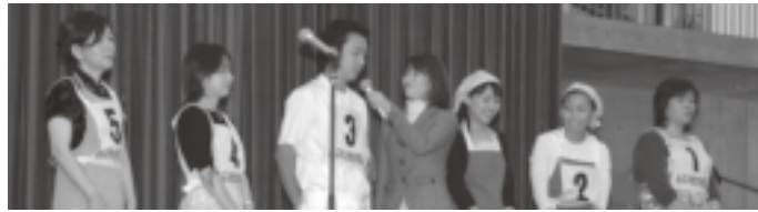
▲市内外から5組(7人)が参加した今回のコンテスト。最優秀賞金20万円の獲得を目指して熱い戦いが繰り広げられました。

小原地区の美しい水と休耕田を活用して養殖されたモクスガニ。新たな小原ブランド品のPR活動として、昨年に引き続き開催されました。