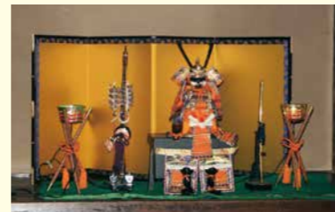
▲勇壮な五月人形が展示されます