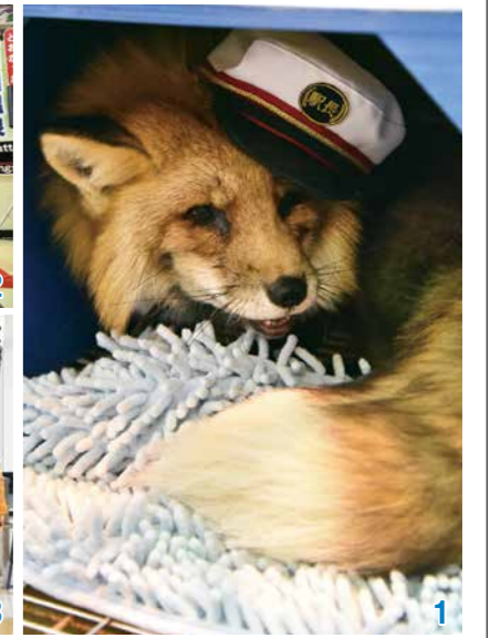
1_観光駅長に任命されたゴロくん 2_白石市観光大使の山崎パニラさんも駆けつけ、盛大に就任を祝いました 3_駅内の柱や階段などに描かれたキツネが、新しい撮影スポットに!