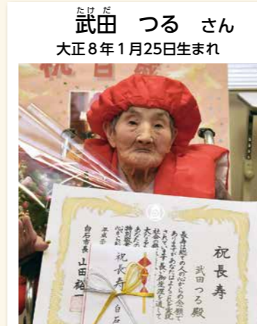
▲食事は好き嫌いなく何でも残さずに食べるつるさん